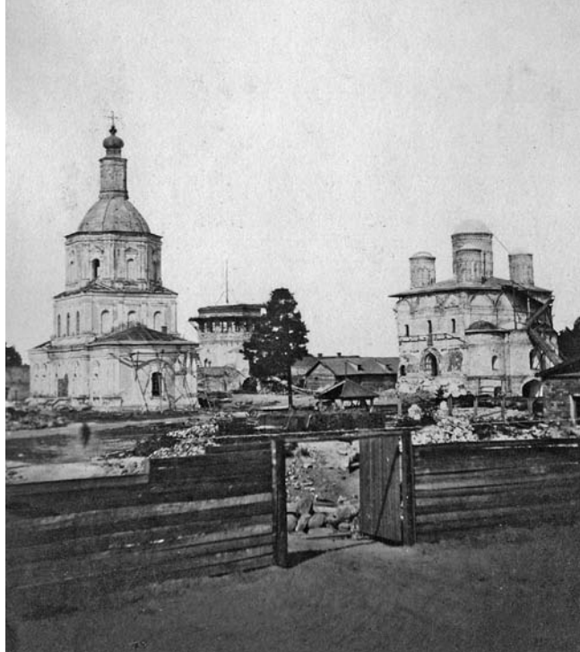
«Богоявленский» период истории духовной школы закончился пожаром 1847 года, обротившим обитель в руины. На фото 1864 года: так выглядел Богоявленский монастырь при начале его воссоздания уже в качестве женского.

План производства экзаменов составлялся ректором и определялся правлением семинарии. Так, в 1816 году назначено было произвести внутренние испытания от 18 по 23 число декабря. В первый день, 18 декабря, от 8 по 12 час дня ученики высшего отделения были испытываемы в знании священной герменевтики, а в 3–4 часа пополудни они же — в еврейском языке; 19 декабря ученики также высшего отделения держали экзамен до обеда по церковной истории, а в 3, 4 и 5 часах по греческому языку; 20 декабря до обеда происходило испытание учеников среднего отделения по философии, а в 3, 4 и 5 часах — по греческому языку; 21 декабря в 9 и 10 часах ученики среднего же отделения подвергались экзамену по ма-