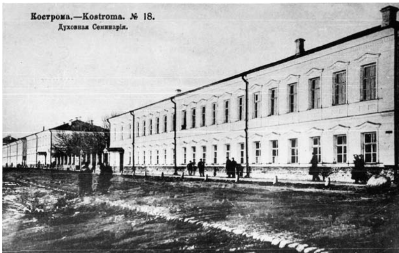
Кострома.—Kostroma. № 18. Духовная Семинария.

Здания Костромской семинарии на улице Верхней Набережной, куда духовная школа переместилась из соборного дома. Открытка начала XX века.