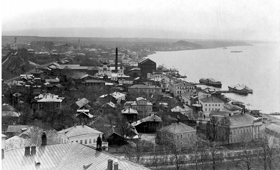
Вид с соборной колокольни на Кострому (вниз по течению Волги). Фото начала XX века.

восходство формы, риторических прикрас над содержанием, отсутствие творчества и оригинальности, преобладание латинской конструкции речи. Несмотря на эти недостатки, справедливость требует сказать, что семинаристы в своих писательских способностях все-таки выдавались пред воспитанниками других средне-учебных заведений. Существовавшая в семинариях метода обучения писать по известным риторическим формулам (периоды, хрии, силлогизмы), распространять предложения синонимами, эпитетами и обстоятельствами, кстати и некстати употреблять тропы и фигуры, прибегать к так называемым топическим местам, игре понятиями, софистике, держась большей частью слога библейского или латинского, — эта метода отзывалась, конечно, рутиной и схоластикой и как крайность достойна порицания. Но эта же метода обучения сочинять имела и свою полезную сторону в том отношении, что помогала еще не установившейся мыслительной способности подходить к предмету и принимать определенный строй, приучала к порядку и логичности в изложении мыслей связной, периодически закругленной речью. Конечно, письменные упражнения на самые разнообразные темы составляли вернейшее средство к развитию и укреплению умственных способностей даже посредственных семинаристов и вместе являлись наилучшим способом к усвоению в умах учеников уроков, преподаваемых наставником. (...)