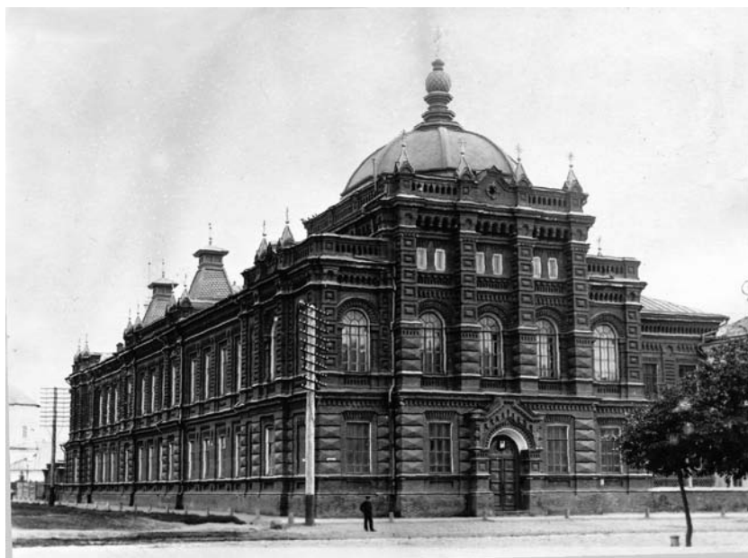
В 1894 году Костромское духовное училище покинуло соборный дом и расположилось в новом, специально для него построенном здании на Павловской улице. Фото начала XX века.