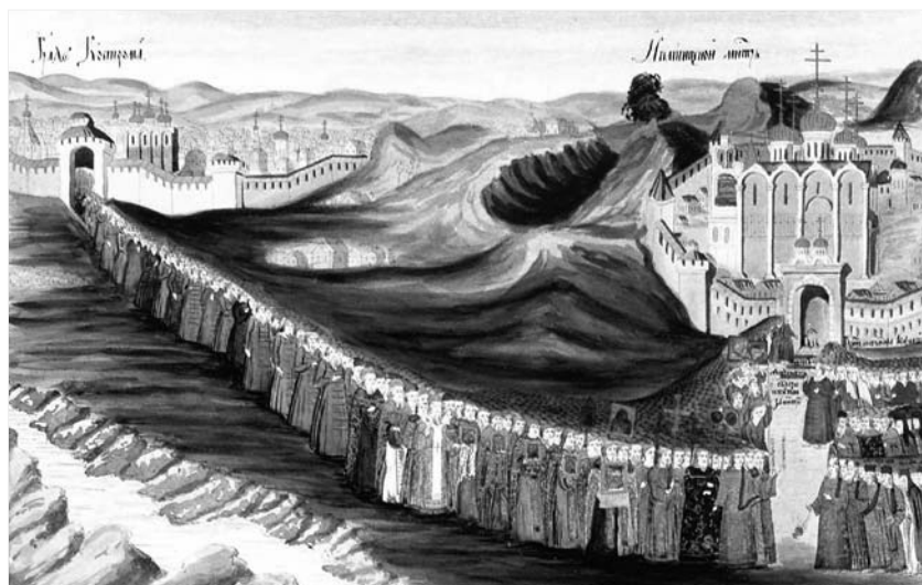
Вид Костромы XVII века на миниатюре из «Книги об избрании на царство великого государя, царя и великого князя Михаила Феодоровича» (1673 год).

Да против той же Никольской башни через ров мост в длину 17 сажен, поперег пол 6 сажени, (л. 6об) вышина от рву две сажени, и тот мост в нынешнем 186 13 году починен уездными людьми.