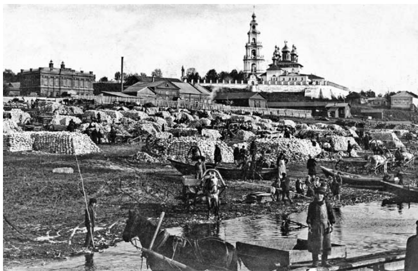
Вид на кремлевские соборы с Волги, от капустного ряда. Фото начала XX века.

А от той глухой башни до Воскресенской воротней башни прясла 38 сажень с полу саженью.