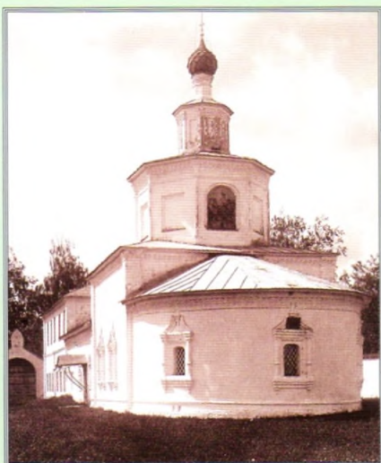
Успенская церковь. Фото начала XX века.

числился только Свято-Троицкий Ипатьевский мужской монастырь). Во время Первой мировой войны в стенах обители располагался лазарет для раненых воинов.