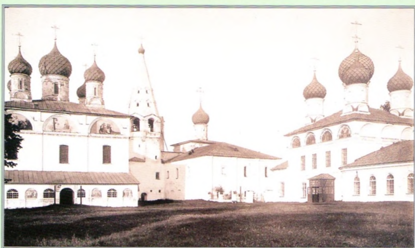
Макариево-Унженский монастырь. Фото начала XX века.

Преподобный Макарий родился в Нижнем Новгороде в 1349 году в купеческой семье. Еще в юности приняв иноческий постриг в нижегородском Вознесенском Печерском мужском монастыре, он впоследствии основал Богоявленскую обитель на северной границе Нижегородского княжества, при реке Лух, и Троицкий Желтоводский монастырь на Волге (именовавшийся так по расположенному вблизи обители озеру Желтые