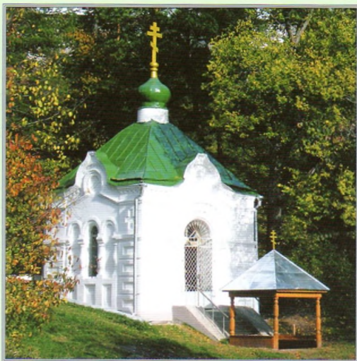
Святой источник и часовня над ним, построенная в 1869 году.

Воды). В 1439 году Улу Мухамед, властитель Казанского ханства (одного из «осколков» Золотой Орды), выступил в поход на Москву, захватив Нижний Новгород и разорив Троицкую обитель. Преподобный Макарий вынужден был покинуть желтоводские пределы и, уйдя на север, основал на горе в унженских лесах монастырь во Имя Святой Троицы. По молитве