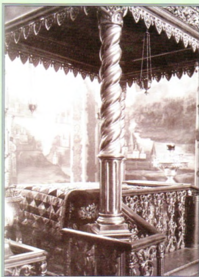
Сень над святыми мощами преподобного Макария. Фото начала XX века.

Монастырь, основанный преподобным Макарием, с течением лет расширялся и благоустраивался. Особое покровительство, которое оказывали обители первый государь из дома Романовых царь Михаил Феодорович (вместе со своей матерью великой инокиней Марфой Иоанновной дважды – в 1612 и 1619 годах – совершавший сюда паломнические поездки) и его преемники, привело к тому, что в XVII веке небольшой монастырь на Унге стал одной из известнейших российских обителей и даже именовался иногда «лаврой преподобного Макария». В 1664-1670 годах здесь был возведен каменный Троицкий собор. В 1670-1674 годах над местом погребения преподобного Макария построили каменную