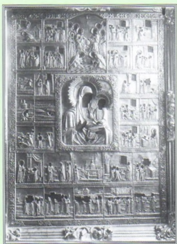
Чудотворная Макарьевская икона Божией Матери. Фото начала XX века.