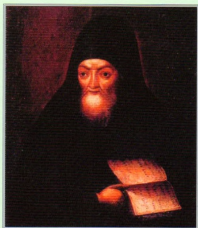
Святитель Митрофан, епископ Воронежский. Портрет XIX века.

В 1778 году из подмонастырской слободы и находившегося рядом села Коврово был образован город, получивший название Макарьев и ставший с 1797 года центром Макарьевского уезда Костромской губернии. В 1802-1880 годах в стенах обители располагалось Макарьевское Духовное училище. В 1854 году Свято-Троицкий Макариево-Унженский мужской монастырь был возведен в ранг первоклассного (в Костромской епархии к тому времени в первом классе