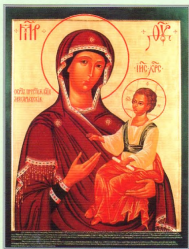
Макарьевская икона Божией Матери, написанная в 1997 году.

празднования стал Макариево-Унженский монастырь. В послании по случаю знаменательного юбилея архиепископ Костромской и Галичский Александр указывал: «История свидетельствует, что этому месту по молитвам преподобного сопутствовало особое Божие благословение. Свято-Троицкий Макариево-Унженский монастырь стал со временем великой обителью, одной из первых по значению в России после Троице-Сергиевой Лавры... Времена воинствующего безбожия исказили облик обители. Многие здесь было предано разрушению. Но милость Божия не оставила сего святого места».