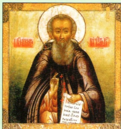
Преподобный Макарий Унженский и Желтоводский. Икона XVIII века.

С ВЯТО-ТРОИЦКИЙ Макариево-Унженский монастырь был основан преподобным Макарием Унженским и Желтоводским в 1439 году на правом берегу реки Унжи в 20 верстах вниз по течению от одноименного города (ныне – село Унжа Макаревского района Костромской области).