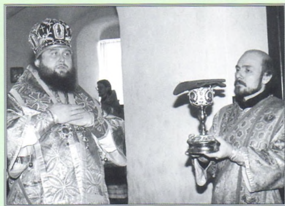
Архиепископ Костромской и Галичский Александр совершает одно из первых богослужений в возрожденном Макариево-Унженском монастыре.

Возрождение обители преподобного Макария началось в девяностых годах XX века. 14 мая 1990 года святые мощи унженского старца, сохранившиеся в запасниках краеведческого музея г. Юрьевца Ивановской области, были возвращены Костромской епархии и перенесены в Кострому, в Воскресенский собор на Нижней Дебре, а затем – в приходскую церковь г. Макарьева. 16 июля 1993 года решением Святейшего Патриарха Московского и всея Руси