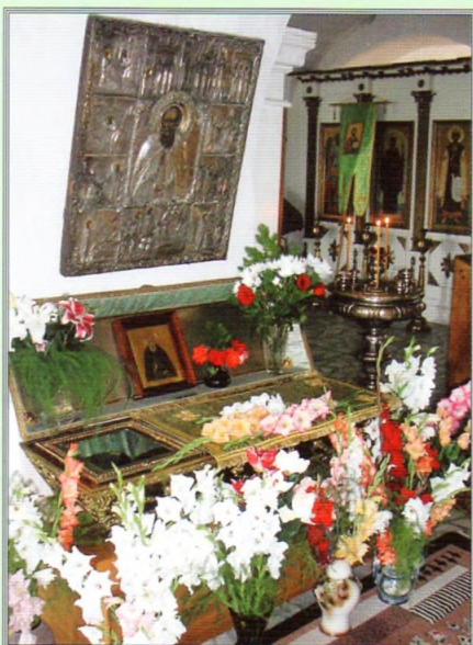
Святые мощи преподобного Макария.

В 1999 году Костромская епархия торжественно отметила 555-летие преставления ко Господу преподобного Макария; центром юбилейного