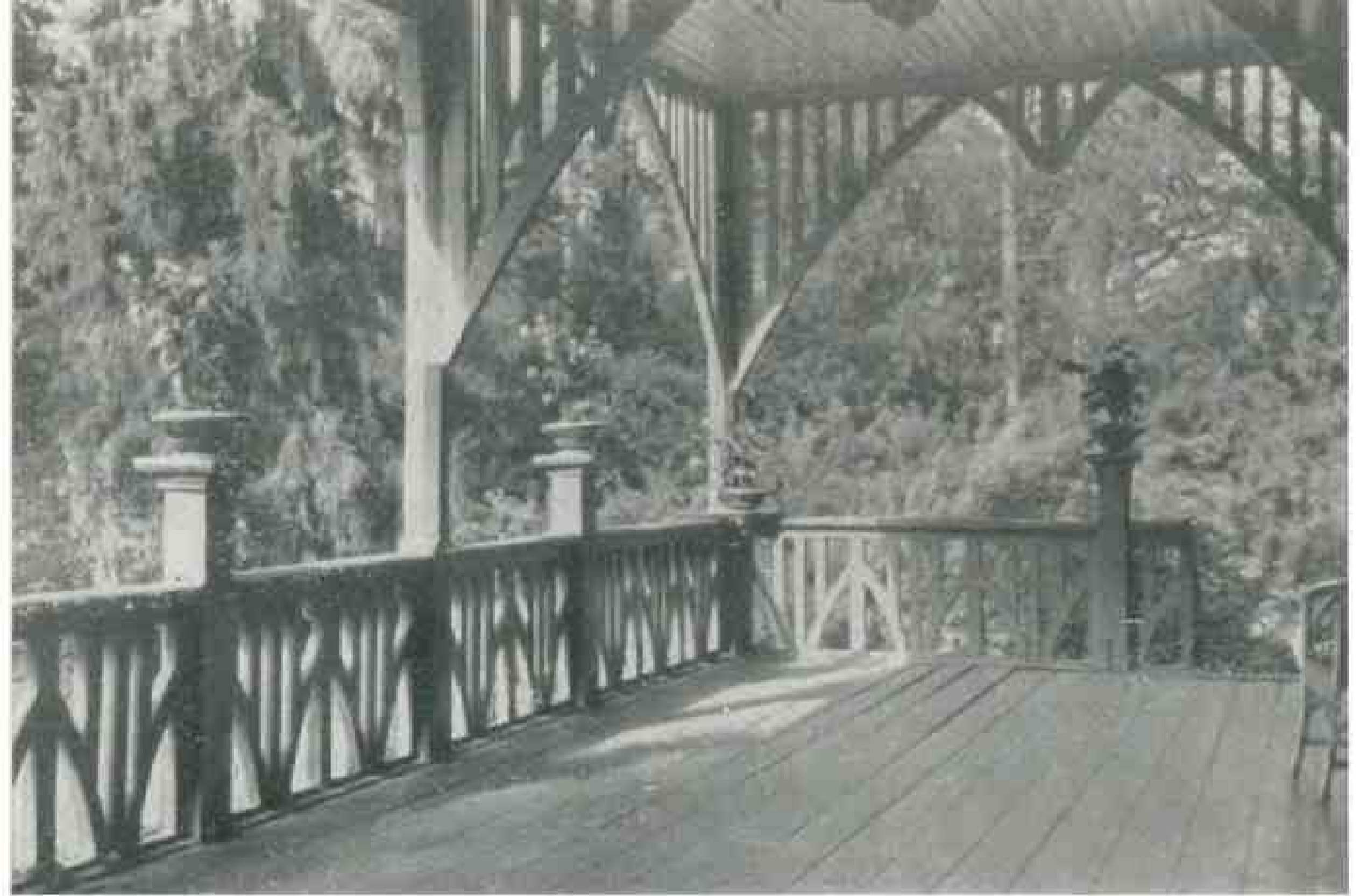
Терраса Голубого дома

сов упиваюсь благовонным воздухом сада. И тогда мне природа делается понятней, все мельчайшие подробности, которых бы прежде не заметил или счел бы лишними, теперь оживляются и просят воспроизведения».