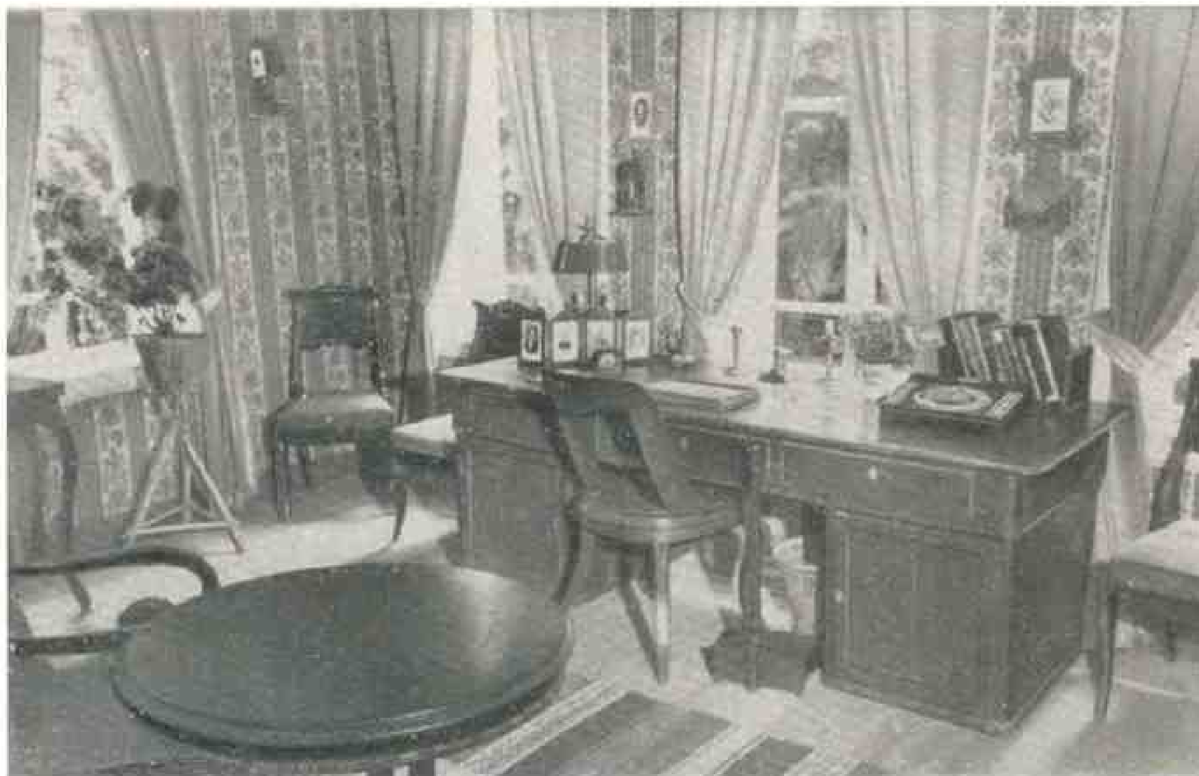
Кабинет А. Н. Островского