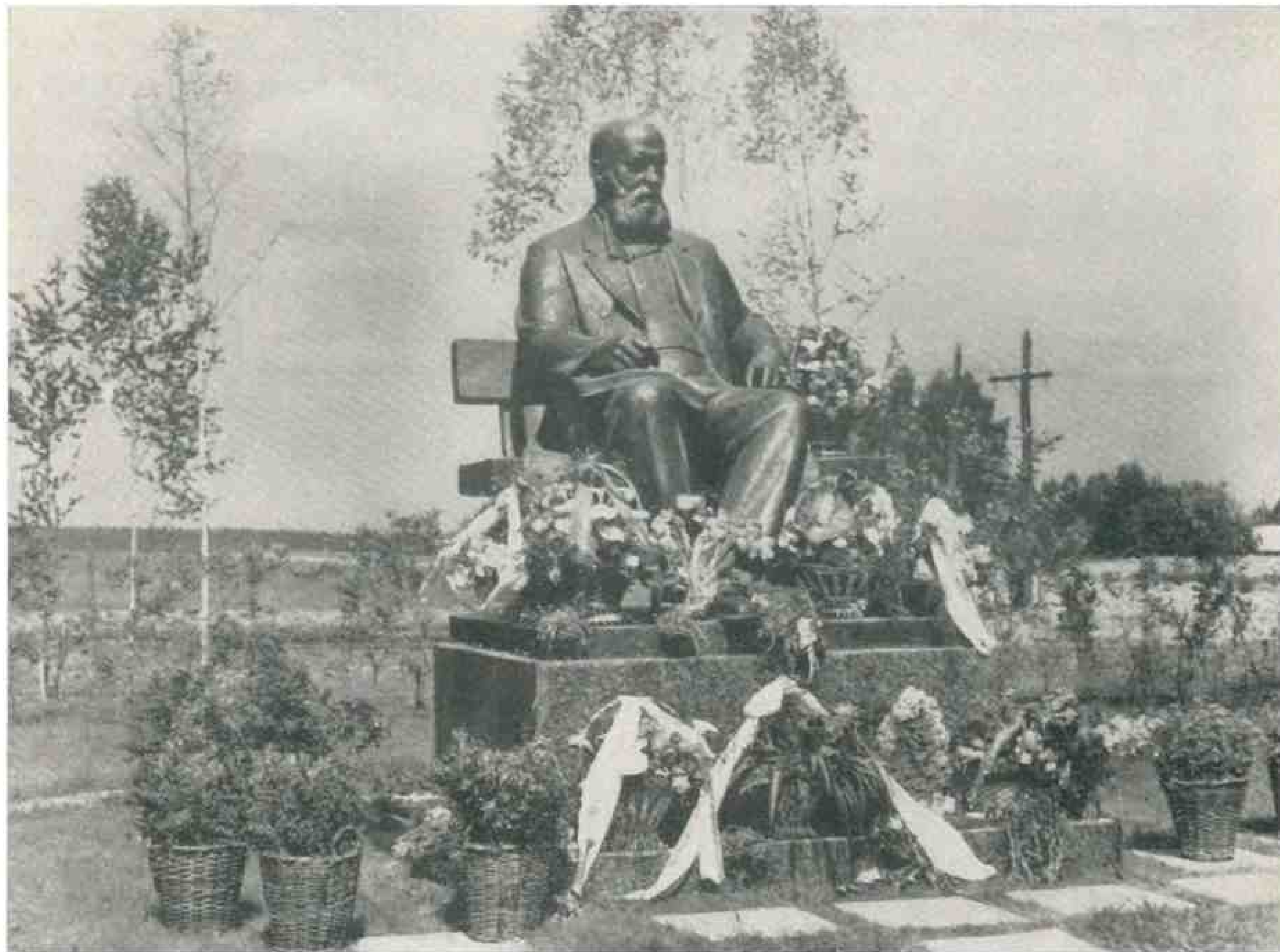
Памятник А. Н. Островскому