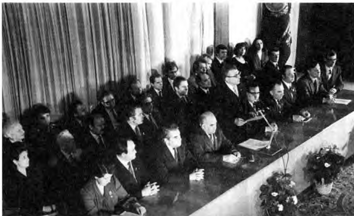
Торжественное собрание, посвященное вручению ордена Красного Знамени Костромскому драматическому театру. Март 1984 г.