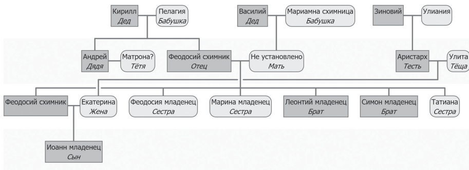
Ил. 3. Генеалогическое древо архимандрита Феодосия по синодичным спискам

протопоп Лукиан Кириллов (№ 24) 1 . В 1671 г. архимандрит Феодосий был переведён настоятелем в Ново-Иерусалимский монастырь. Таким образом, все три списка могут быть датированы временем около 1670 г.