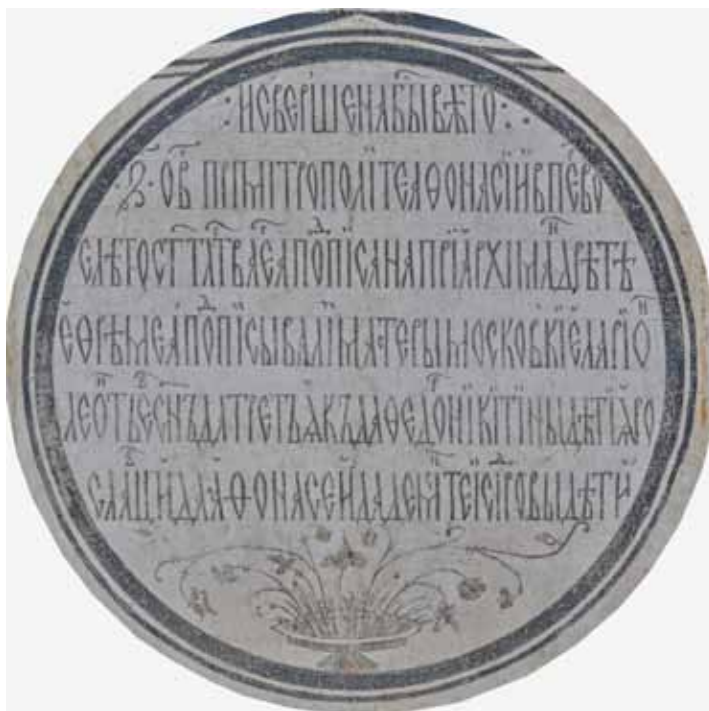
Рис. 2. CIR0563. Ярославль. Спасо-Преображенский монастырь. Спасо-Преображенский собор. Надпись с именами мастеров, расписывавших храм. Между 24 февраля и 31 августа 1564 г.

писании, так и в «фонетическом», при оглушении звонкого шумного «д» перед глухим согласным «т».