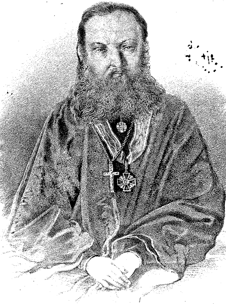
Профессоръ Философіи, Протоіерей Георгій Голубитскій.