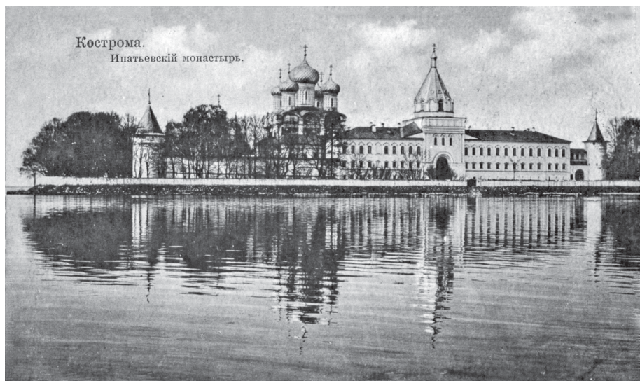
Ипатьевский монастырь. Открытка начала XX века.

XIX век — легенда о Захарии-Чете получает широкое распространение благодаря публикациям в печатных изданиях и становится единственной официальной версией основания Ипатьевского монастыря.