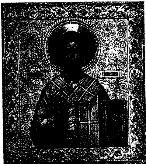
Св. Апостолъ Варнава, Небесный покровитель О-ва.