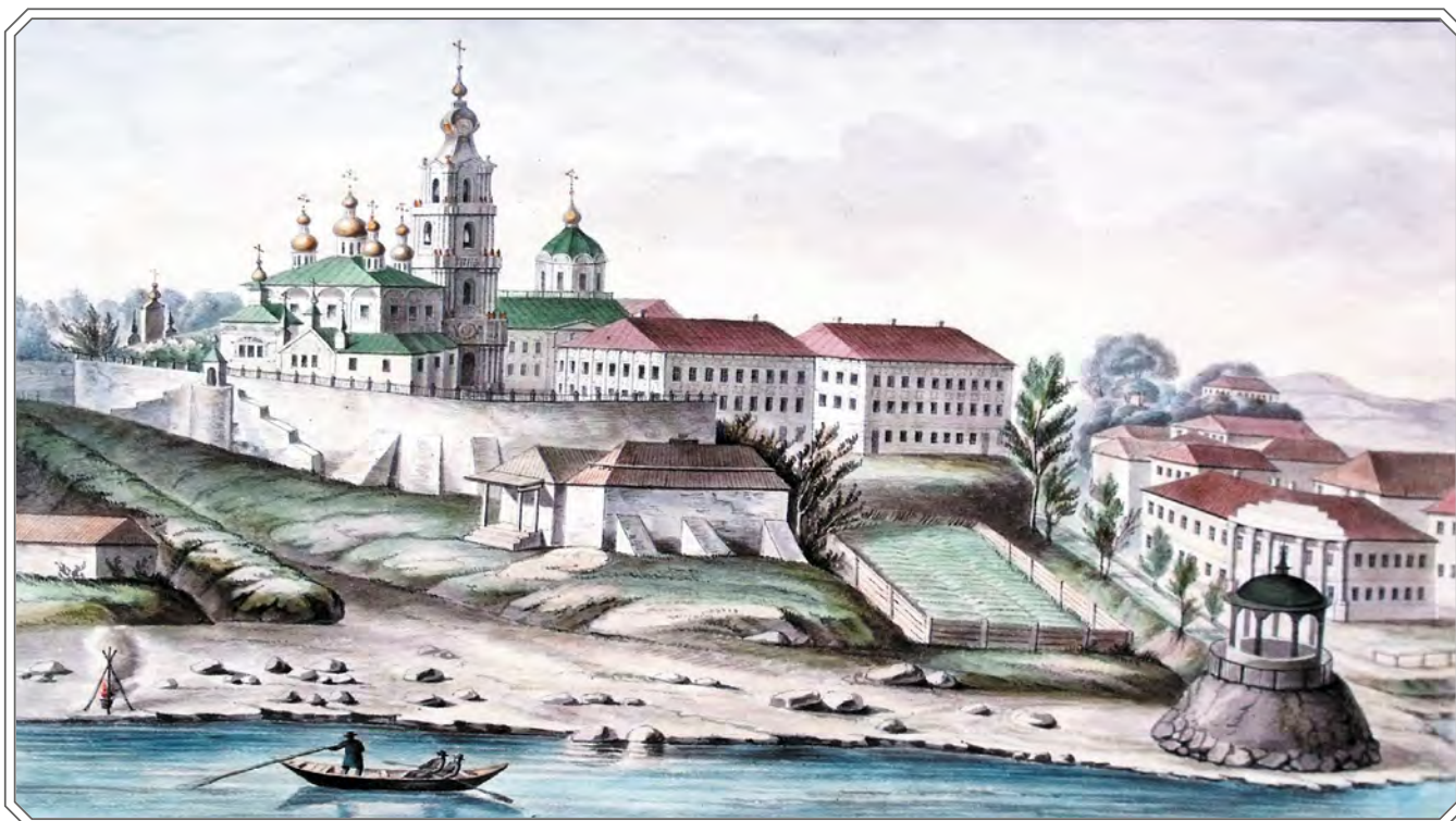
Соборный ансамбль Костромского кремля. Акварель XIX века.

В XXI веке добрые традиции продолжают, наше время вписывает в книгу святости новые страницы: проистекает монашеская жизнь, строятся храмы, открываются новые приходы... Святые обители и целебные источники, Церковно-археологический музей в Ипатьевском монастыре и скаутская организация при Костромской митрополии – об этом и многом другом, что славит Кострому и привлекает многочисленных паломников, и повествуется в очередном, 125-м, выпуске «Губернского дома». Начинается же повествование с рассказа об истории и чудесном возрождении Костромского кремля, с разговора о главной нашей святыне – Феодоровской иконе Божией Матери.