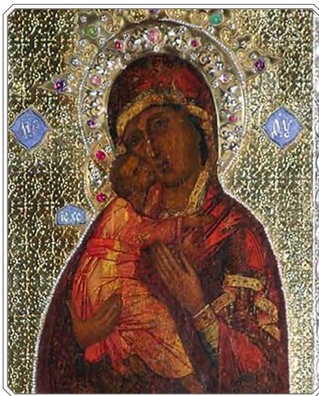
Нерехтская Владимирская икона Божией Матери (вторая чудотворная), список с первой чудотворной Нерехтской Владимирской иконы Божией Матери. 2019 год.