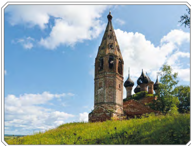
Казанский храм села Княгинино Нерехтского района. 2018 год.

В Троицкой церкви села Красное-Сумароково хранилась часть одежды преподобной Евфросинии, великой княгини Московской (1353 – 1407). Преподобная Евфросиния (в миру Ев-