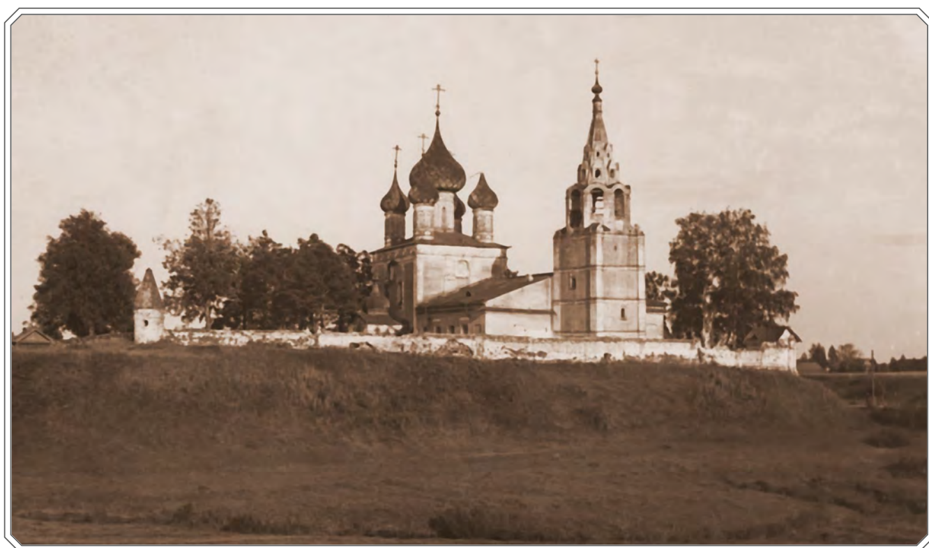
Троицкий Пахомиев Сыпанов монастырь. Начало XX века.

В самой древней Нерехте главным храмом был Борисоглебский деревянный собор, в котором сохранялась икона святых князей