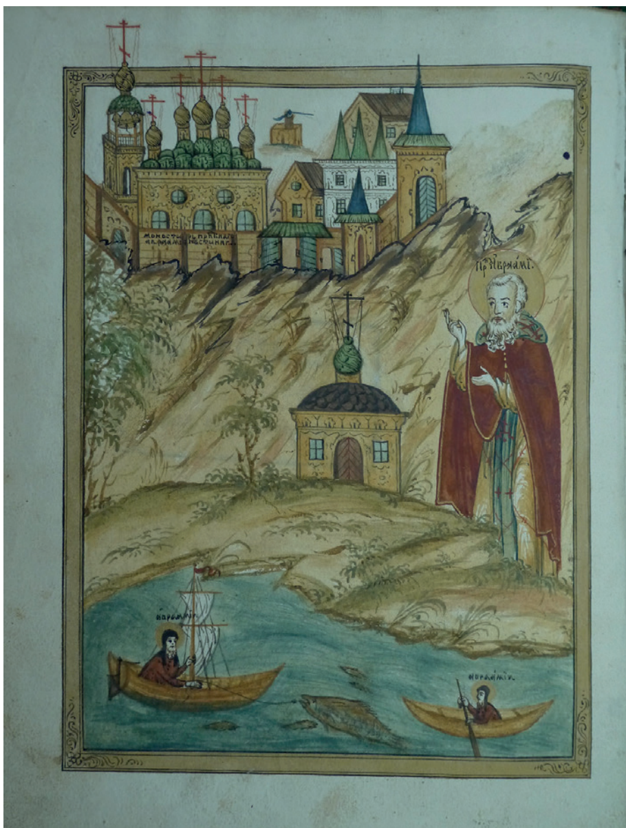
Рис. 1. Житие прп. Авраамия Галичского. ОР РНБ. Александро-Невская Лавра, А-69. Л. 2 об. XVIII в. Изображение Авраамиева Городецкого монастыря.

вновь найденной записи максимально полно указано имя Матроны (как по мужу, так и по отцу), что позволило свести воедино ранее встречавшиеся в источниках варианты ее именованя. Наличие сразу нескольких имен, особенно в случае с женскими именами, было нормой для изучаемого времени.