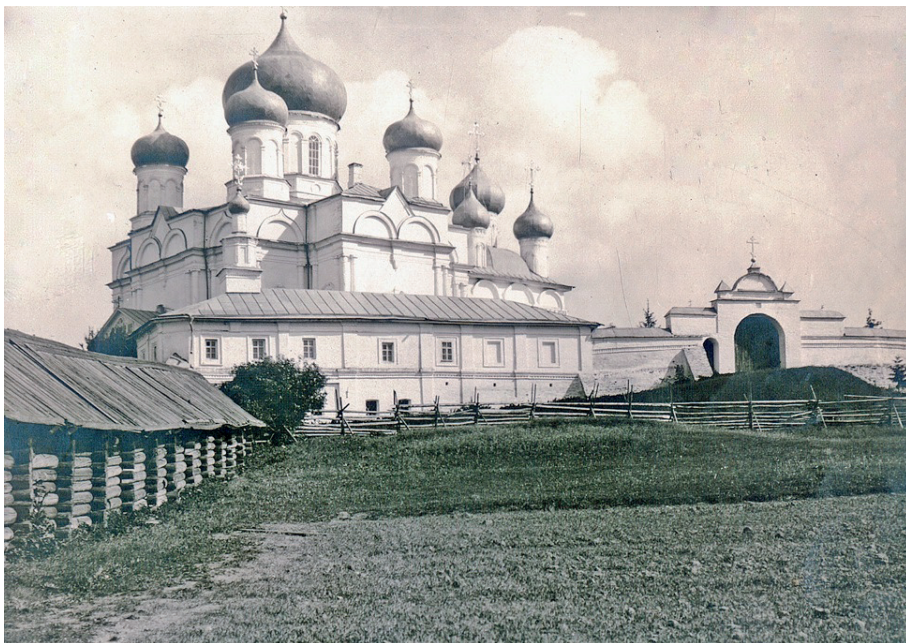
Рис. 2. Авраамиев Городецкий монастырь. Вид нач. XX в.