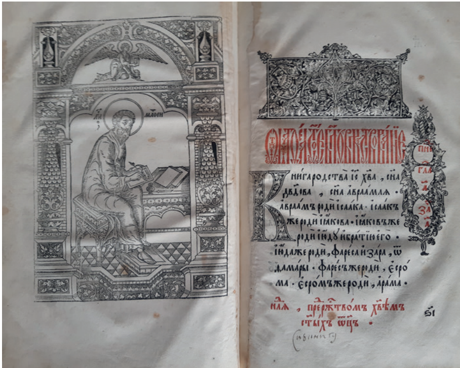
Рис. 3. Евангелие 1628 г. с началом вкладной записи Матроны Калистратовой. Собрание М. С. Бывшева.