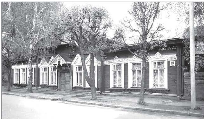
Здание Костромской музыкальной школы 2010 г.