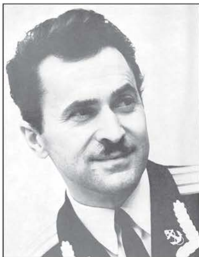
Военный дирижёр Б.М. Победимский

Одной из прекрасных традиций военного времени стало выступление в Костроме сводного оркестра, составленного из оркестрантов ленинградских военно-учебных заведений. Программами таких концертов капельмейстеры дирижировали по очереди, включая в них сочинения русской и зарубежной классики. Эти произведения были рассчитаны на высокий уровень исполнительского мастерства. В репертуаре оркестра в обязательном порядке присутствовали произведения патриотической тематики. Дирижёры выбирали сочинения, созвучные суровым военным дням, воскрешавшие страницы героического прошлого народа, звавшие на борьбу с врагом. Звучали фрагменты из оперы «Иван Сусанин» М.И. Глинки, торжественная увертюра