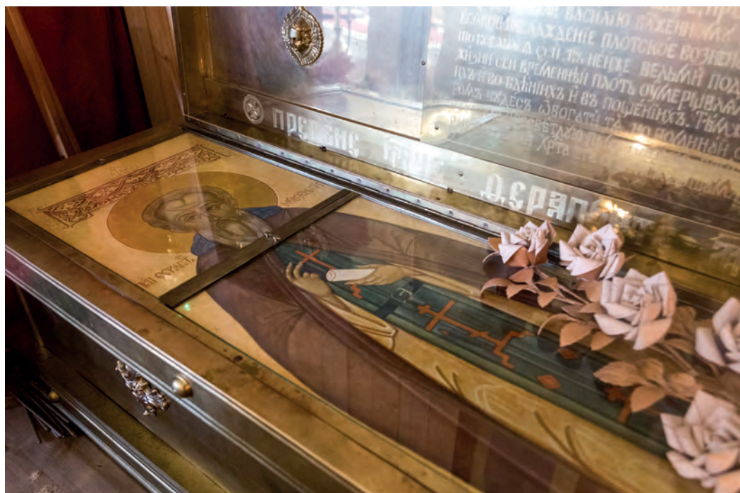
Икона преподобного Ферапонта над его святыми мощами. Фото 2019 года.