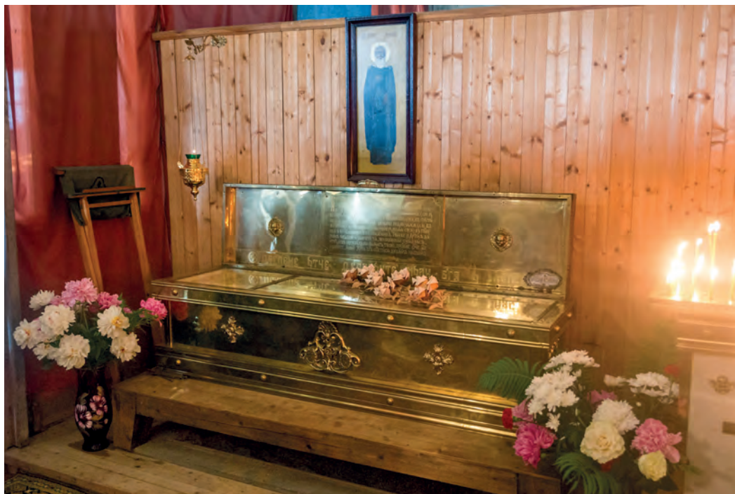
Рака над святыми мощами преподобного Ферапонта Монзенского в Благовещенской церкви села Ферапонт. Фото 2019 года.

ном издании, подготовленном к этому празднованию, было перепечатано житие святого в редакции 1908 года 21 .