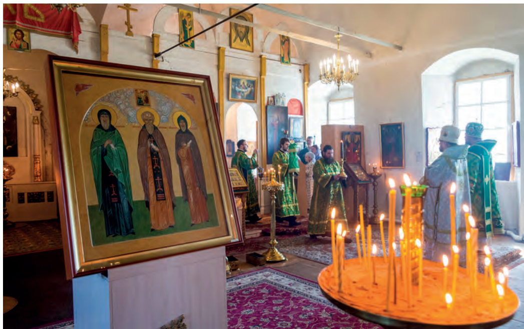
9 июня 2020 года. Митрополит Костромской и Нерехтский Ферапонт и епископ Галицкий и Макарьевский Алексей совершают Божественную литургию в Благовещенской церкви села Ферапонт.

ный свет. Он шел к утрине от стад конских, еще во тьме ночной, и когда поклонялся честным иконам у Святых ворот, услышал говор людей многих внутри монастыря, как бы голос просящих пощады: «Ратники отошли, и мы отойдем: уйдем отсюда, да не опалишь нас небесным огнем!». В страхе остановился инок у Святых ворот; внезапно как молнией облистало весь монастырь и опять погрузилось все во мрак; не было более слышно голосов. Он пошел к церкви святителя Николая, видя, что внутри ее свет; на праге 82 церковном сидел преподобный, как бы утомленный, отдыхая от трудного дела. Страх объял инока, но вскоре миновался, когда преподобный начал говорить ему: «Видишь ли, брат, как умножилась здесь нечистота от нахождения поганых, а иное и от здесь живущих, оскверняющих себя калом греховным 83 ; уже в третий раз поновляется место сие силою Божией и действием Святого Духа; скажи Адриану, чтобы не восходили люди на гроб мой».