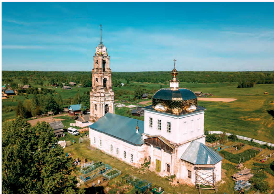
Благовещенская церковь села Феропонт. Фото 2022 года.

ли раку над святыми мощами преподобного Феропонта. Тогда же была уничтожена и памятная часовня на месте древнего монастыря, и теперь только сохранившаяся здесь старая сосна указывает, где совершали свои иноческие подвиги монзенские угодники Божии. Закрытая церковь первоначально никак не использовалась, но во время Великой Отечественной войны в ней стали хранить зерно, а затем здесь разместили склад сельпо — и этот склад находился в церковных стенах более сорока лет.