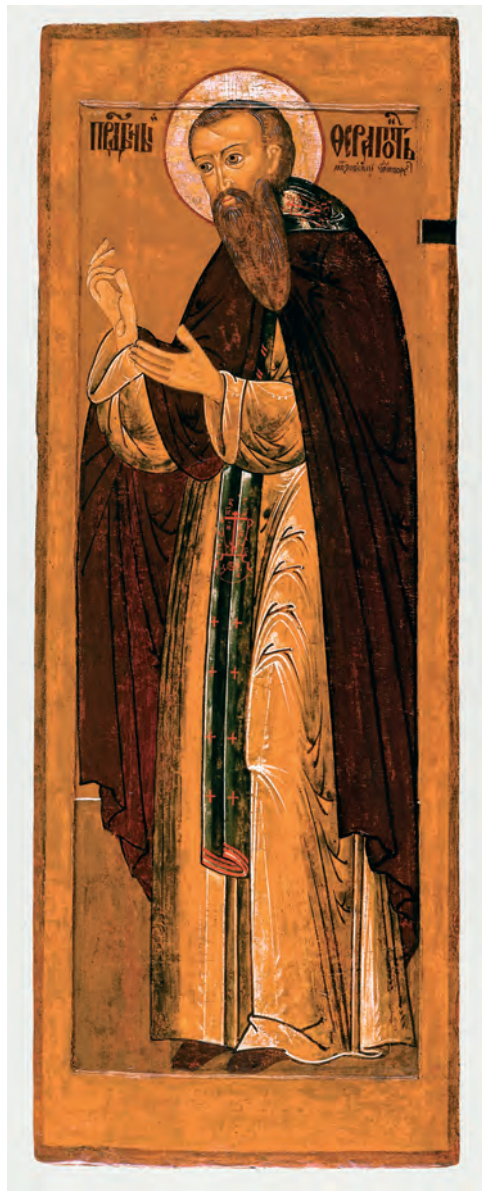
Преподобный Ферапонт Монзенский. Икона первой четверти XVII века из Покровской церкви села Пемы Галичского района Костромской области.