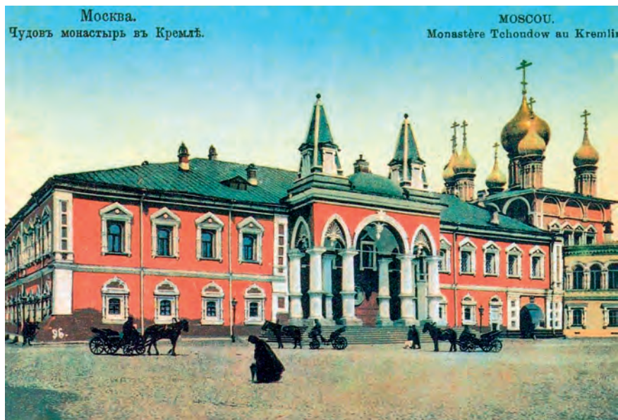
Чудов монастырь в Московском Кремле. Открытка начала XX века.

Тогда еще более утвердилось в мысли Адриана и всей братии соорудить монастырь на новом месте. Строитель пошел в царствующий град 40 в обитель Чудовскую возвестить обо всем Пафнутию, и тот с радостью дал ему еще более денег для сооружения монастыря. Просил он Святейшего Иова Патриарха дать Адриану благословенную грамоту 41 на новое место; Патриарх исполнил их общее желание и вместе с грамотами и антиминсом для освящения церквей отпустил ему богатую милостыню. Архимандр-