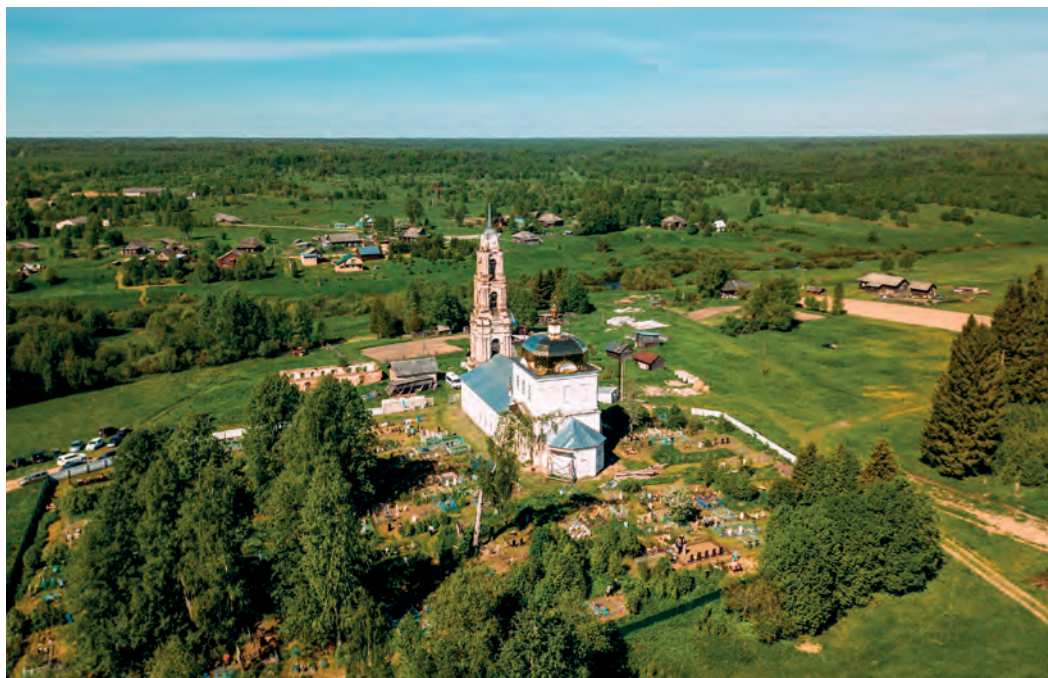
Вид на Благовещенскую церковь села Феропонт, где с конца XVIII столетия почитают святые мощи монзенских преподобных. Фото 2022 года.

тому, не обратили внимания на то, что Феропонт явился Адриану в пятое лето по преставлении, что соответствует названной в Житии дате — 1585/1586 год» 14 .