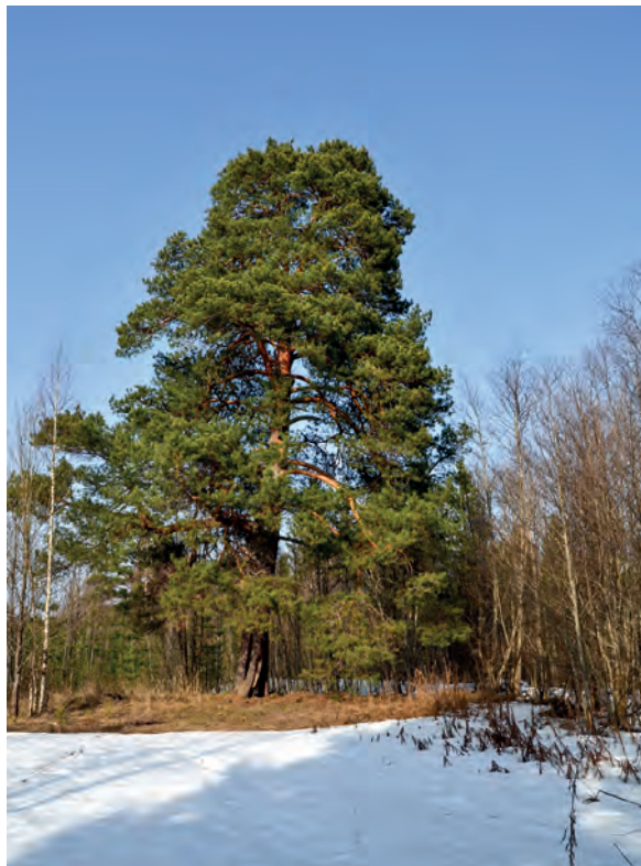
Старая сосна — ориентир, указывающий на место нахождения Благовещенского Монзенского монастыря до конца XVIII века. Фото 2012 года.

Подведем итог. Указание на совпадение дня кончины преподобного Ферапонта, 12 декабря, с Неделей святых праотец предписывает нам три возможных года этого события: 1585, 1591 и 1596.