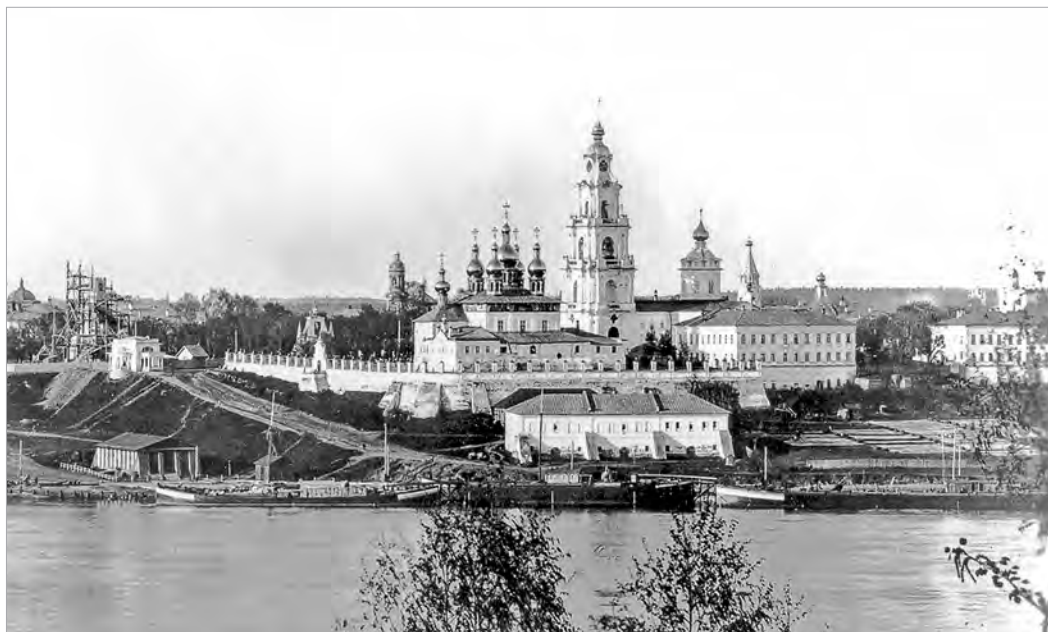
Вид на Костромской кремль с правого берега Волги. Фото десятих годов XX века.

в народе глубоким почитанием и при этом по смирению не принимали священный сан; из костромских святых для примера можно назвать преподобного Тихона Луховского, преставившегося ко Господу в 1503 году. Но при всем уважении к нашим предкам не будем их идеализировать: жители Костромы — большого по тем временам города на торговых путях — не были поголовно святыми, и призывы к благочестивой жизни не всегда встречали у них адекватный отклик. Вспомним хотя бы события 1652 года, когда костромичи устроили настоящий бунт против протопопа Успенского собора Костромского кремля Даниила и игумена Богоявленского монастыря Герасима, руководивших церковными делами и решительно насаждавших в народе благочестие 31 . Можно предположить поэтому, что уважение костромичей к преподобному Ферапонту объяснялось не только его высокой духовной жизнью, но и известностью подвижника как человека знатного, однако добровольно отказавшегося от всех привилегий и ставшего простым иноком в основанном им монастыре.