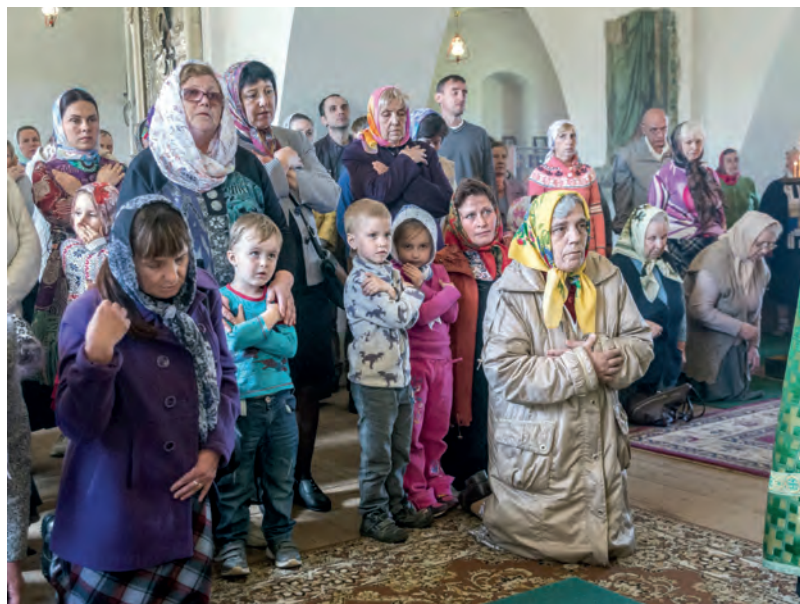
9 июня 2017 года. На праздничной Божественной литургии в Благовещенской церкви села Ферапонт.

здрав, как пришел исцеляться к недужному?». Но преподобный поднял его и сказал: «Помнишь ли, как однажды на берегу реки Костромы, где ты хотел соорудить монастырь, я говорил тебе, что ты будешь мне отцом и узнаешь имя мое? Вот это исполнилось ныне, но опять умоляю: не открывай никому сказанного мною, как истинный отец и хранитель заповеданной тайны, доколе я жив буду. От нынешнего дня, когда я исповедал тебе грехи мои, по совершении двух лет и шести месяцев исполнится надо мною то, что Бог повелит».