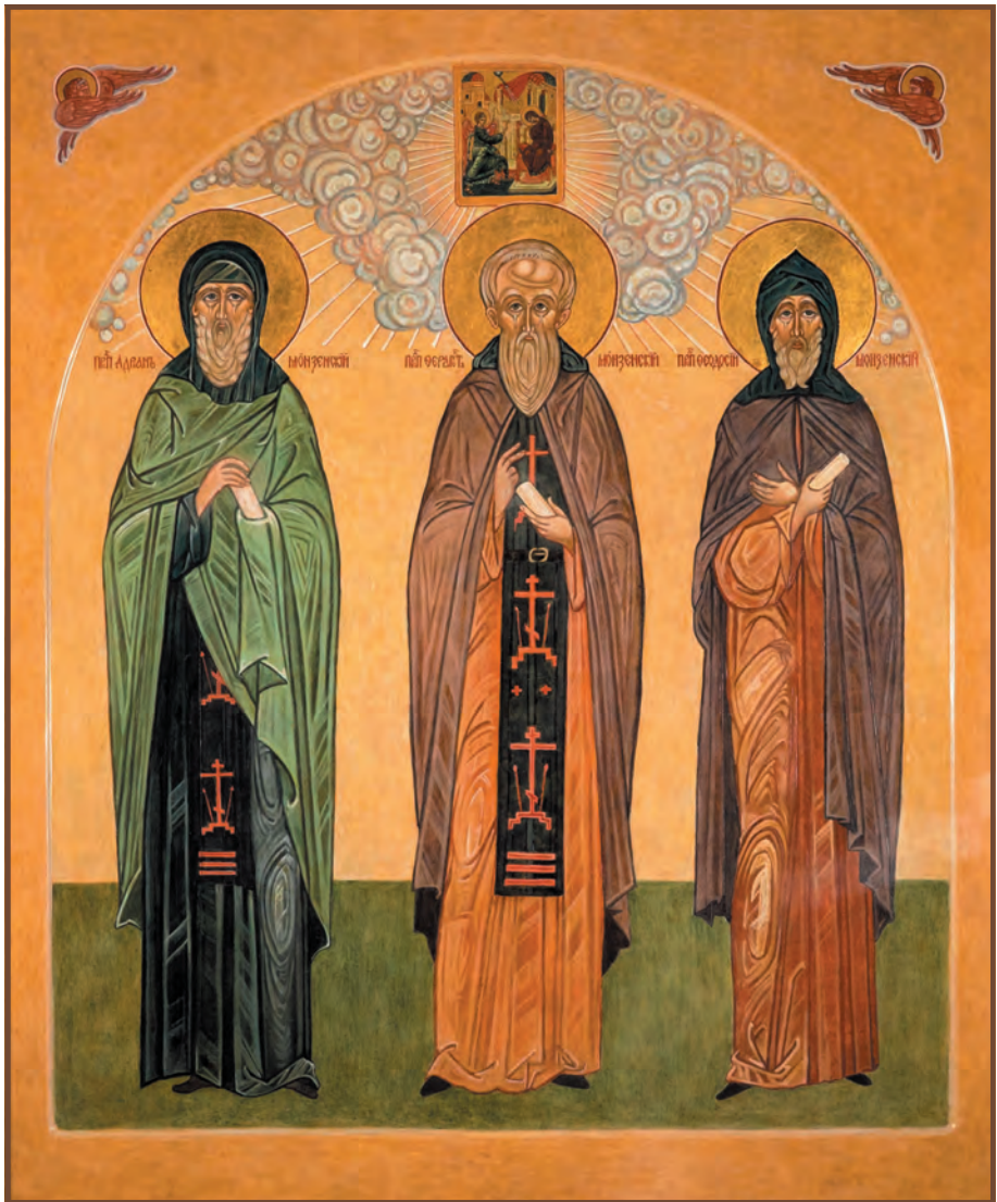
Преподобные Ферапонт, Адриан и Феодосий Монзенские. Современная икона.