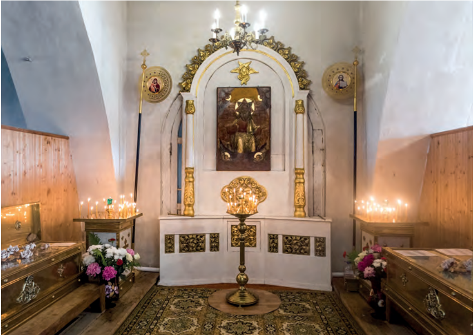
Раки над святыми мощами монзенских преподобных в Благовещенской церкви села Феропонт. Фото 2019 года.