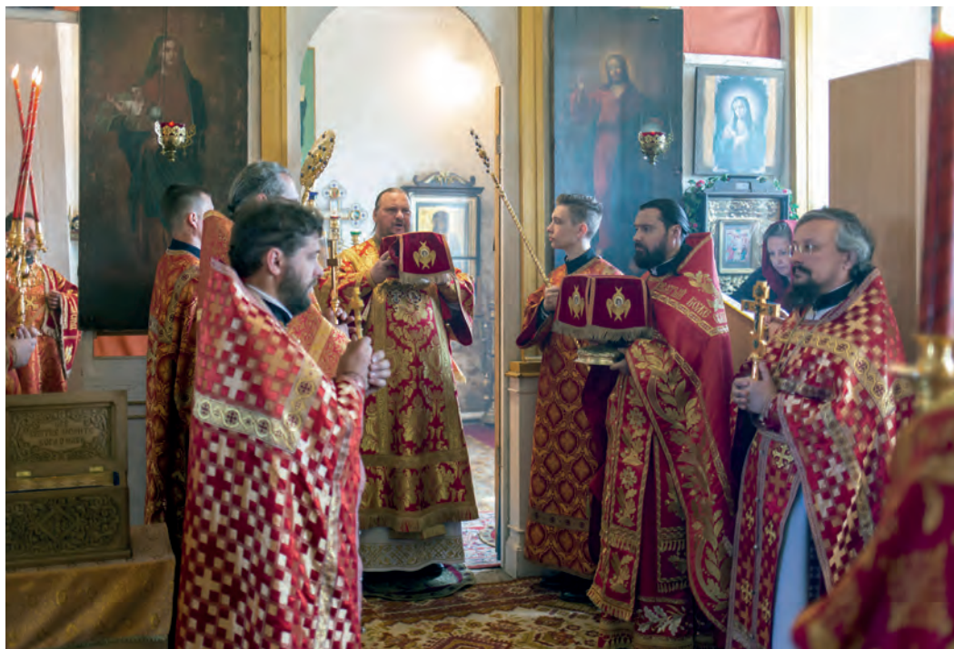
9 июня 2021 года. Праздничная Божественная литургия в Благовещенской церкви села ФерAPONT.

упомнил. Сколь благ Господь во святых Своих, сподобивший таких чудес преподобного ФерAPONта уже в последние сии роды в Российской земле, в области Галичской на устье Монзы реки, в пустыне, где вселился святой муж сей и востекло сие новое светило, просвещая с верою призывающих его на земле и на реках! Я написал сие, да не будет в забвении добродетельное житие его по Боге и да не лишены будут такого дара не ведавшие жития его, ищущие же своего спасения да обретут себе пользу духовную. Да не скажут некоторые: «Как мог он обо всем вспомнить? Ибо уже 39 лет протекло после преставления преподобного». Но я собрал то, что слышал из уст многих свидетелей, знавших его при жизни и видевших чудеса, которые доселе, как кипящий источник, текут от честного его гроба.