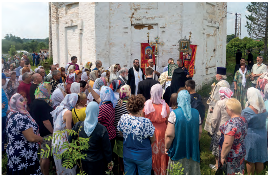
9 июня 2019 года. Крестный ход после праздничной Божественной литургии в Благовещенской церкви села Ферапонт.

гали. После многих обходов вышли они опять на Лешский Волок, где их всех переловили и предали городскому суду. На допросе все единодушно показали, что имели намерение ограбить монастырь, но заблудились в лесу и голодали пять дней; на шестой увидели перед собой неведомого старца и хотели схватить его, чтобы вел их к обители, но не могли; он все шел впереди их лесом, доколе не вывел на прежний волок, и тут внезапно скрылся, а их обошли и поймали.