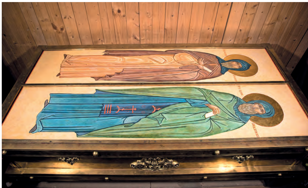
Рака над святыми мощами преподобных Адриана и Феодосия Монзенских в Благовещенской церкви села Ферапонт. Фото 2019 года.

В ужасе отвечал Феодосий: «Отпущения грехов моих». — «Иди и подвижайся, — сказал ему чудный Ферапонт, — и как творил в начале, так и доверши; не по многом времени увидишь будущий свет». Феодосий пал на землю и помолился, чтобы даровал ему видеть опять здешний свет, но преподобный возразил: «Свет сей есть прелесть суетного века; ты же своей слепотой избавишься от будущей тьмы», и стал невидим. Старец Феодосий осязал руками двери церковные и нашел их запертыми, а сам по-прежнему ничего не видел.