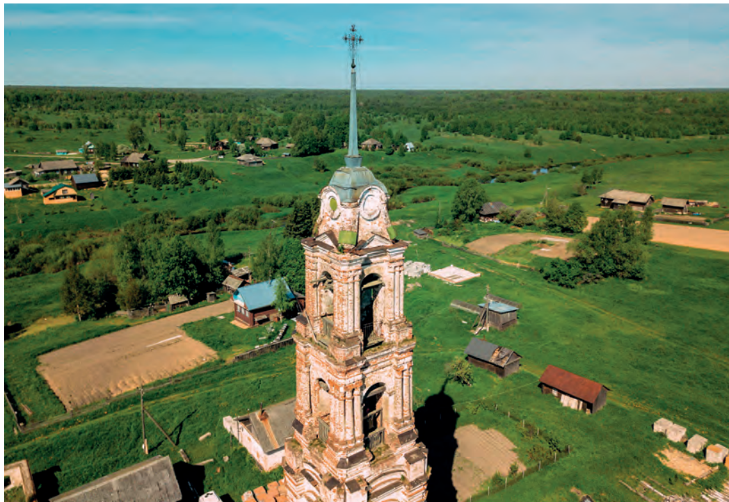
Вид на окрестности села Феропонт. Фото 2022 года.