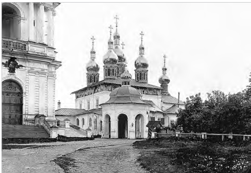
Успенский собор Костромского кремля.