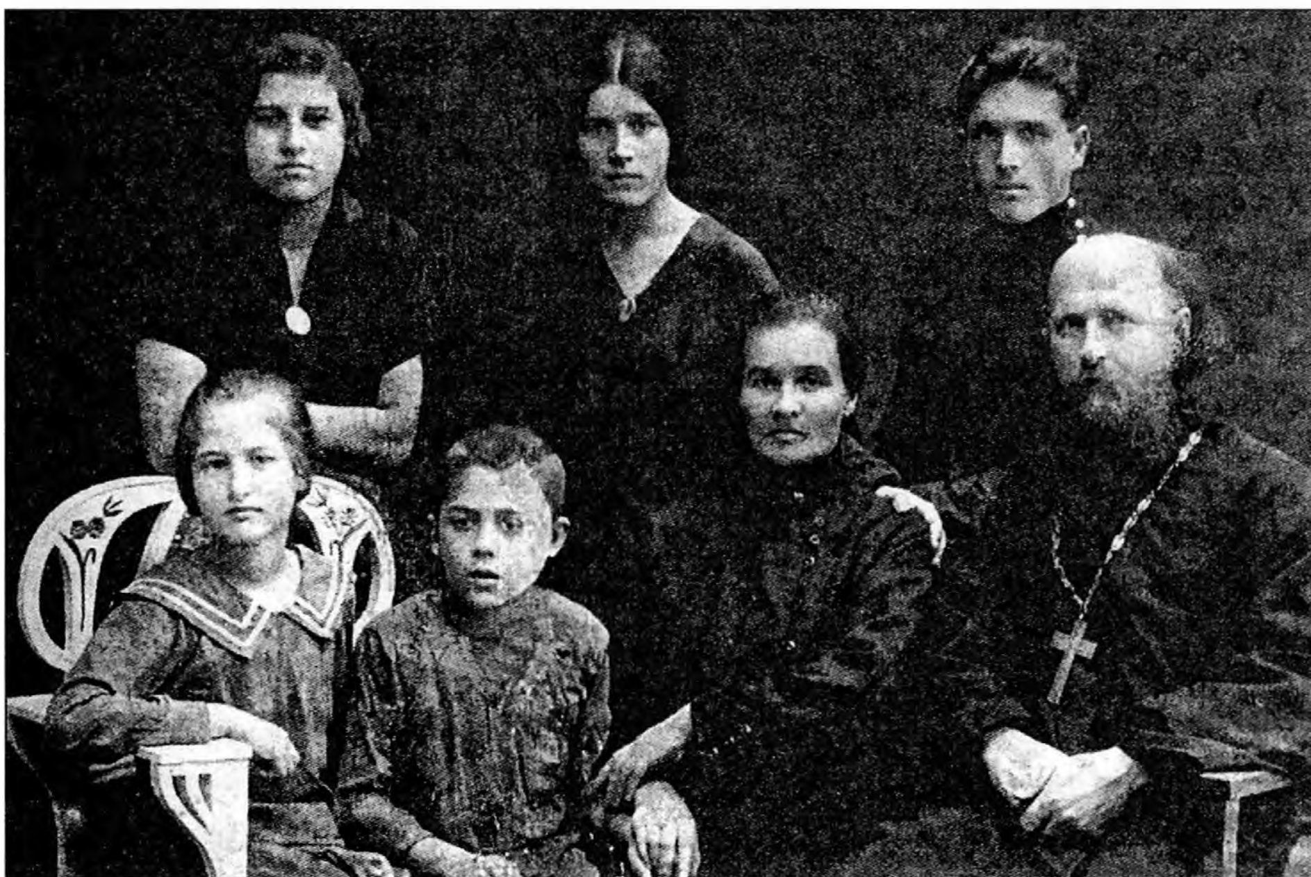
Семья Острогских. Фото начала тридцатых годов XX века.

«Вопрос: Что Вам известно о существовании нелегальной церкви в квартире епископа Макария и совершались ли