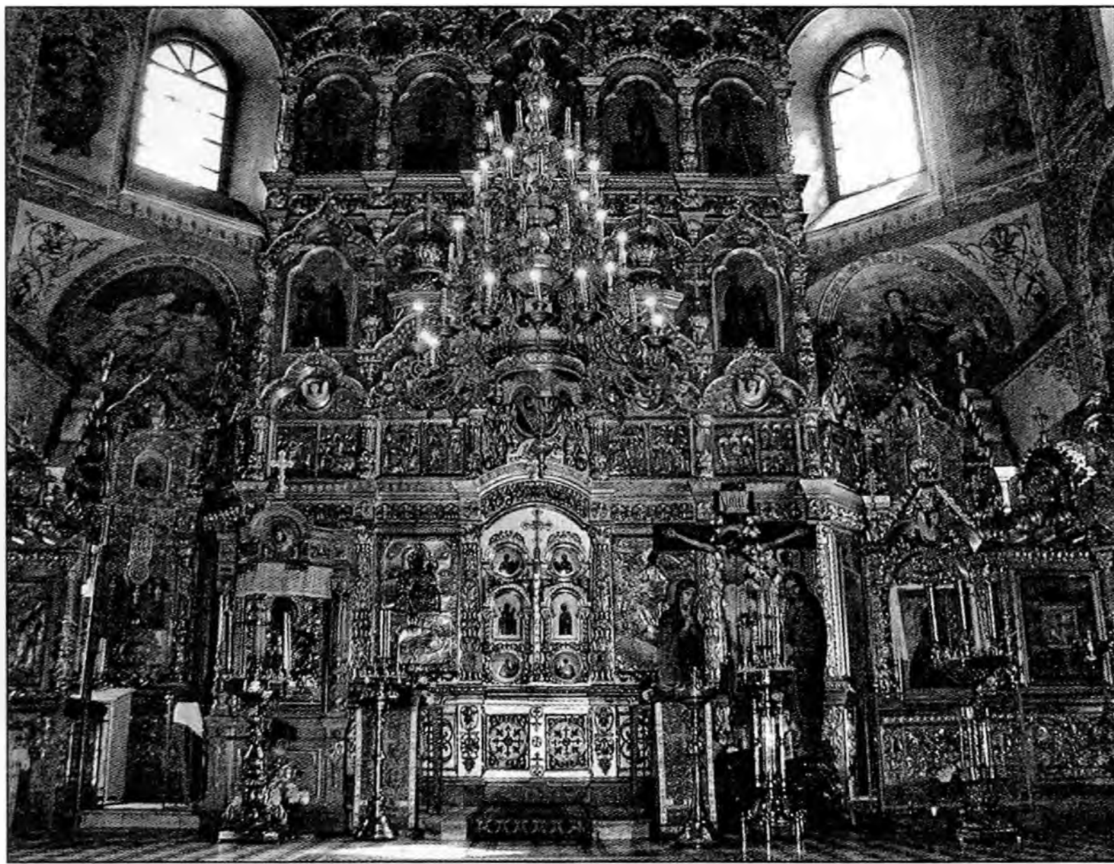
Внутренний вид Александро-Антониновского храма. Фото 2002 года.

Подлинные письма священномученика Макария к Р.А. Ржевской тем более ценны для нас, что детально изображают повседневную жизнь владыки незадолго до ареста. Епископ Макарий живет довольно замкнуто, общаясь лишь с ограниченным кругом близких людей; ежедневно посещает храм в Селище (отметим – «сергиевский»), заботится о своем огороде, несколько тяготеет бытовыми проблемами, переживает по поводу сложных взаимоотношений с М.И. Сегеркранц 44 . При этом он ведет обширную переписку со своими корреспондентами – представителями самых различных церковных кругов, от активного и убежденного «иосифлянина» протоиерея Николая Пискановского до «сергиевца» священномученика Иоасафа и (с учетом сделанной выше оговорки) неизвестного украинского священнослужителя; последнему владыка отнюдь не внушает «уходить в катакомбы», но советует – как, используя советское законодательство, уменьшить взимаемый со священнослужителей налог. Если доверять свидетельству протокола допроса 22 октября 1934 года, во время