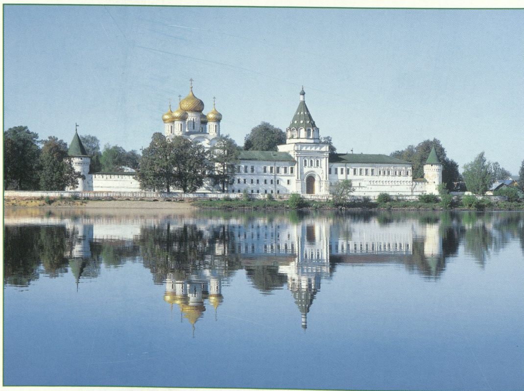
Свято-Троицкий Ипатьевский мужской монастырь града Костромы.

Святейший Патриарх Московский и всея Руси АЛЕКСИЙ II