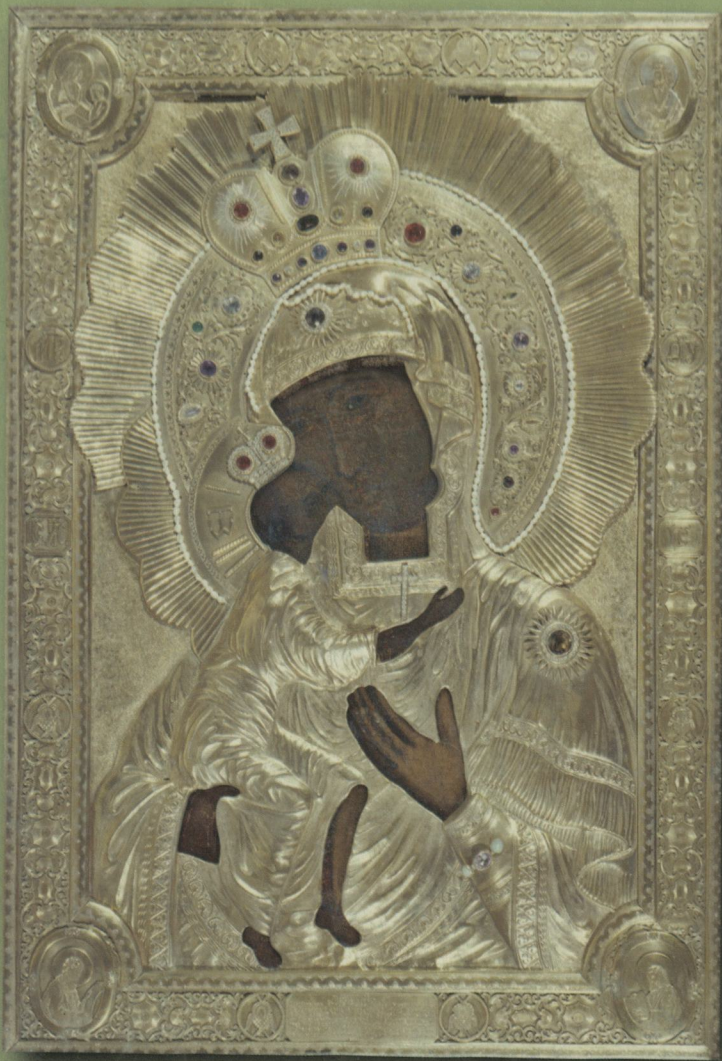
ФЕОДОРОВСКАЯ ИКОНА БОЖИЕЙ МАТЕРИ