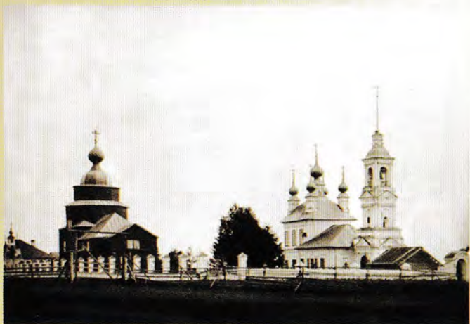
Ильинская и Николаевская церковь в селе Верхний Березовец. Фото нач. 20 в.

«Мне хотелось бы сказать несколько слов о значении подвига новомучеников ... не только членам Церкви, не только нашим прихожанам, но и людям светским. Потому что новомученики — это герои, а без героев не может существовать народ, не может существовать нация.