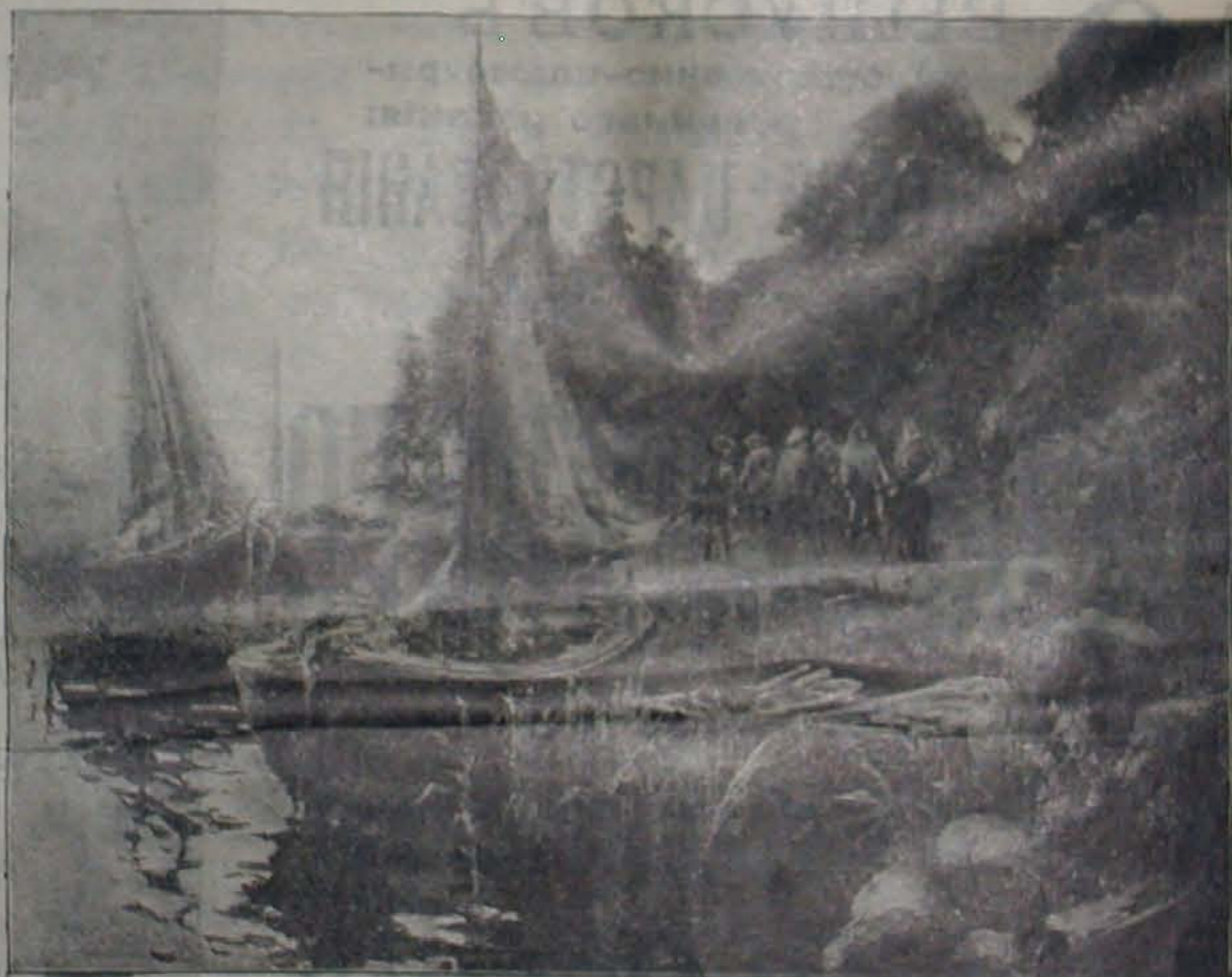
Видъ мѣстности, гдѣ основанъ Петербургъ.

ОТДѢЛЕНІЯ: въ Петербургѣ, Большая Садовая, домъ № 25; въ Кіевѣ, Подоль, Гостинный дворъ; въ Енотеринбургѣ, Покровский просп., домъ Поповичевой; въ Варшавѣ, Краковское предместье, домъ № 1; въ Одессѣ, уголъ Преображенской и Еврейской ул., д. Лѣтника, № 58; въ Нижегородской ямаркѣ, на Шоссе; въ Харьковѣ, Университетская улица, домъ № 41, Чикиныхъ; въ Воронежѣ, Московская улица.