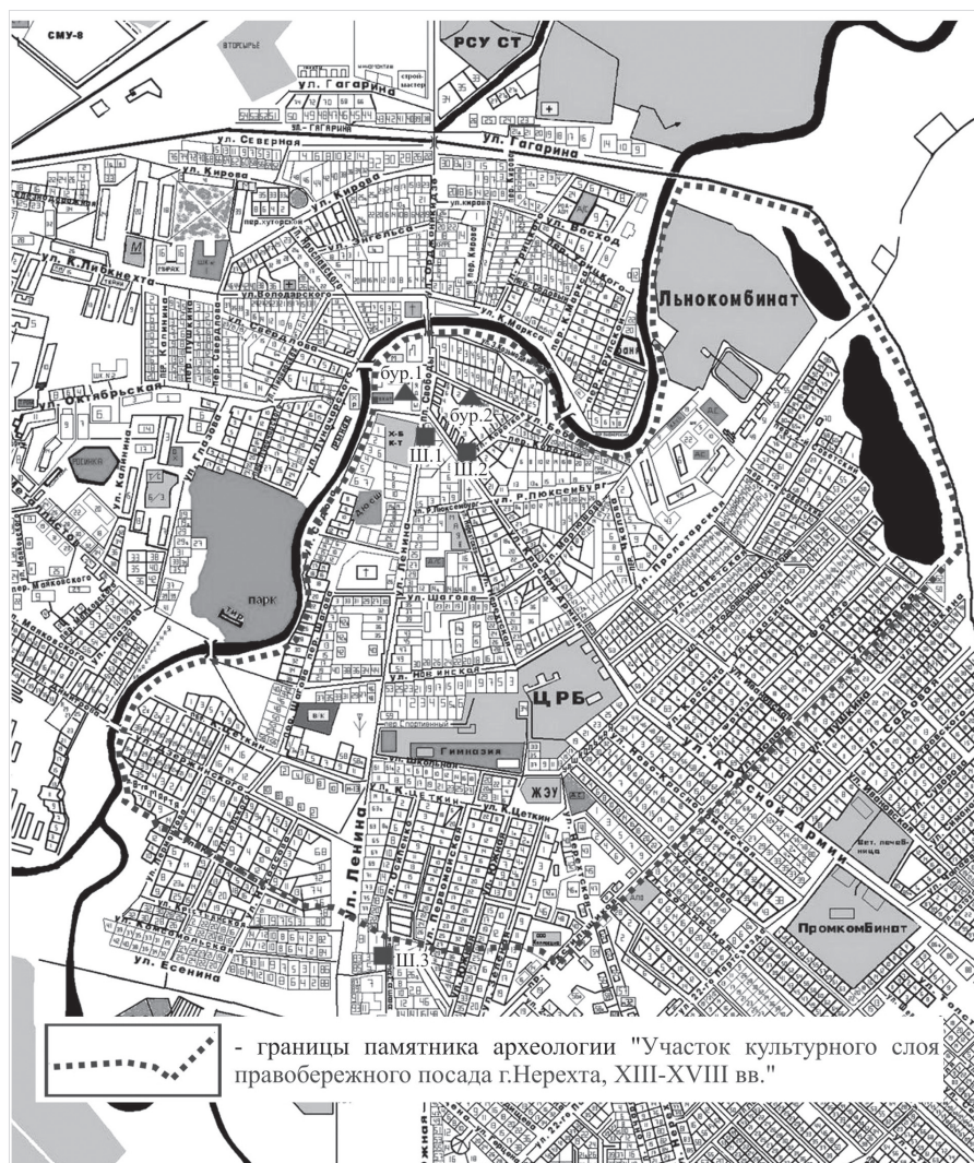
Ил. 1. План Нерехты с указанием мест разведочных бурений и шурфовки 2015 г.