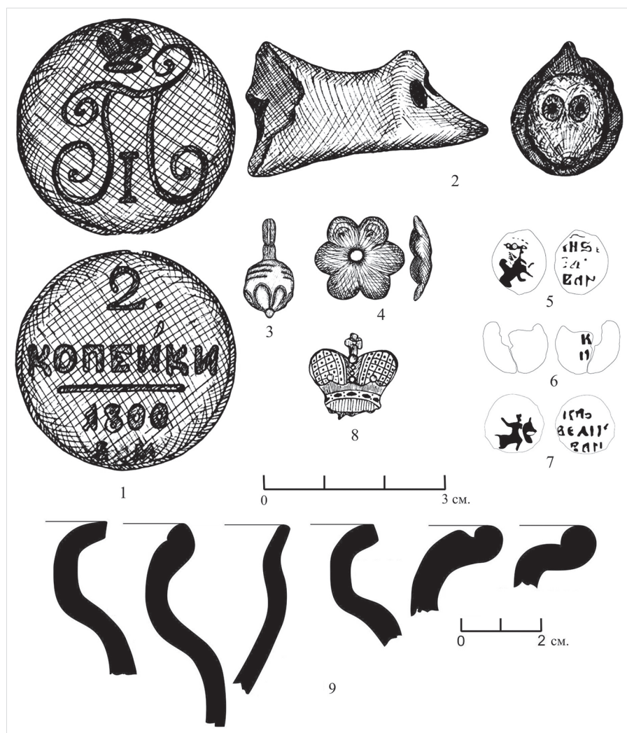
Ил. 3. Наиболее выразительные находки из шурфов 1 (№ 1–7, 9), 2 (№ 8) 2015 г.: 1 – монета, медный сплав; 2 – фрагмент игрушки, глина; 3 – пуговица, металл белого цвета; 4 – накладка, медный сплав; 5–7 – монеты, серебро (?); 8 – фрагмент изделия, медный сплав; 9 – венчики сосудов из нижнего горизонта культурного слоя шурфа 1 (вне объекта)