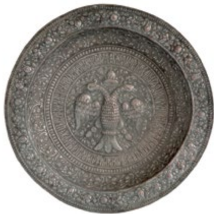
Блюдо XVII в. Металл, чеканка