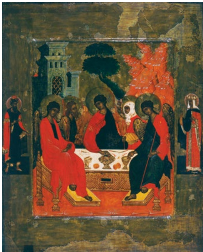
Икона «Троица Ветхозаветная, с князем Всеволодом и княгиней Ольгой на полях». XVI в. Дерево, темпера