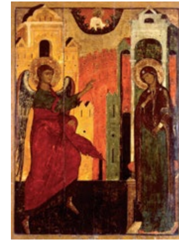
Икона Благовещение Сер. XVII в. Дерево, темпера