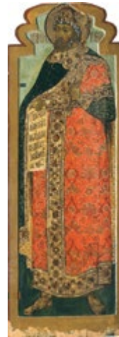
Икона Праотец Иов 1679 Дерево, темпера

Этот замысел можно было осуществить только с привлечением столичных реставраторов. Однако на участие в этом деле реставраторов ГЦХРМ рассчитывать не приходилось. Они брали одну-две работы на несколько лет. Организация