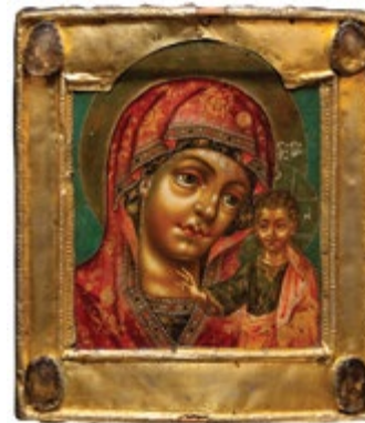
Икона Преподобный Сергий Радонежский с житием. 1586 г. Дерево, темпера Икона Святитель Николай Великорецкий с житием. Сер. XVI в. Дерево, темпера Икона Рождество Христово. 1682 г. Дерево, темпера Икона Богоматерь Казанская. Втор. пол. XVII в. Дерево, темпера

ми музея из закрытых, заброшенных церковей области.