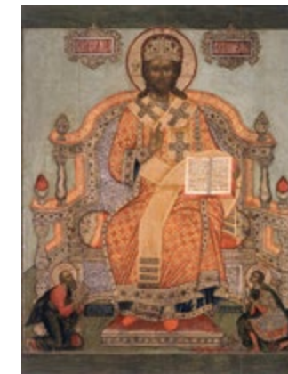
Икона Спас Великий Архиейер 1687. Дерево, темпера