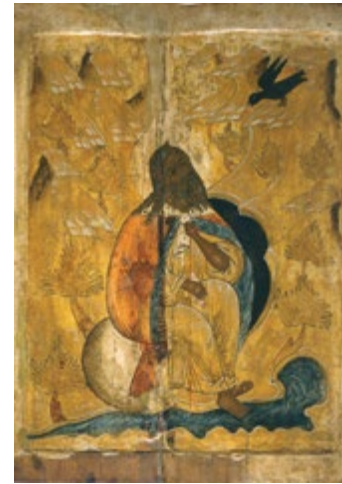
Икона Пророк Илья в пустыне XVI в. Дерево, темпера