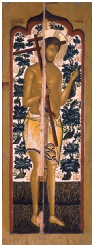
Икона «Благоразумный разбойник» Сер. XVII в. Дерево, темпера

В историческом очерке о Костроме братьев Лукомских есть краткое описание Романовского музея, прежде всего предметов церковной старины, составляющих главную ценность собрания 7 . Для Г. К. Лукомского оказалась наиболее интересной скульптура из дерева. «Параскева Пятница XVII в., представляющая фигуру святой в одежде расписанной не масляными красками, а темперой; икона той же святой – XVIII в. в нише киота, с венчающими ее короною и парящими над нею двумя ангелами, в композиции есть черты украинского барокко; та же святая, более ранней эпохи (XVII в.). Глава Иоанна Крестителя на блюде (XVII в.) очень красива по своей экспрессии. Композиция "Страшный суд", замечательна выполнением в резьбе из дерева. Фигуры ангелов XVII–XVIII вв. также резные из дерева. Очень интересны резные изображения Спасителя, сидящего в темнице, и резной иконостас