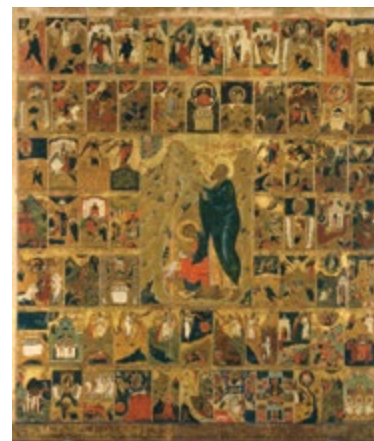
Икона Богоматерь Федоровская со Сказанием. 1680-е. Дерево, темпера