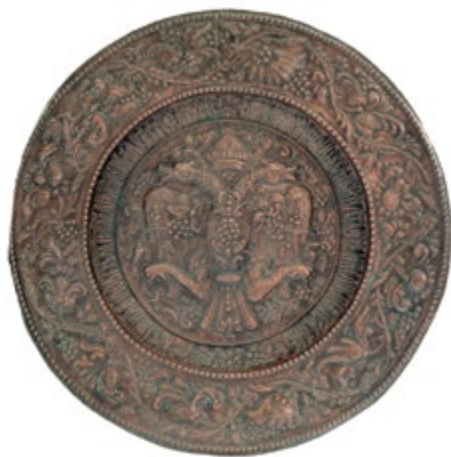
Блюдо с изображением двуглавого орла XVII в. Металл, чеканка