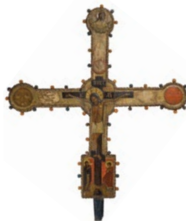
Икона Святитель Василий Великий. XV в. Дерево, темпера Икона Рождество Христово. Фрагмент. Кон. XVII в. Дерево, темпера Крест запрестольный. Кон. XVII в.(?) Дерево, темпера