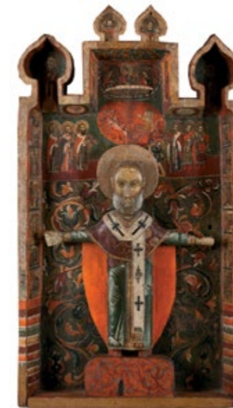
Скульптура Никола Можайский в киоте XVII в. Дерево, резьба, темпера

27 Каткова С. С. Нерехта и ее храмы // Наше наследие. 2002. № 62.