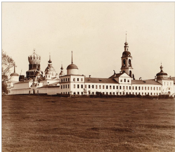
Николо-Бабаевский монастырь. Общий вид. 1911 г.