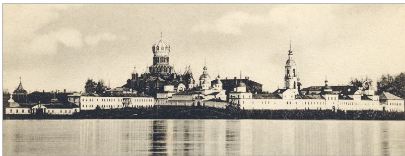
Николо-Бабаевский монастырь. Вид с Волги. Фото нач. XX в.

одного поколения иноков к другому, было записано на одной монастырской печатной месячной минее в следующих словах: «Ико-н чудотворн я святого Николы, приплыв рекою Волгою н б б йке, большом весле, прист к берегу; бл говернии же люди, обретош оную, изнесош и пост виш н брег в дубр ву зело кр сну, идеже мон стырь ныне; и н ч ш людие мнозии стек тыся н поклонение святой иконе и чудес деяхуся; и прииде некто инок Сергиев мон стыря Ио нн и устрой первый хр м молитвенный из б б ек и придел во имя Сергия Чудотворц Р донезского; и н ч ш мон стырь созид ти, и великую нужду претерпев ху от огр блений и р зорения злых людей» (Миния с приведенной надписью сгорела во время пожара 26 января 1870 г., но есть копия с надписи).