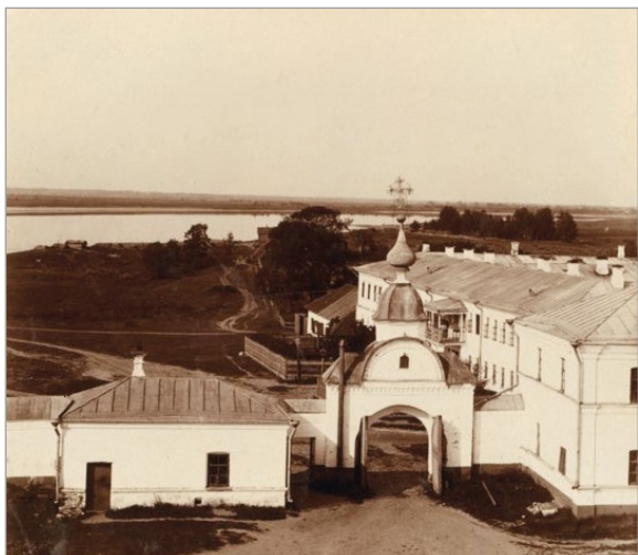
Выход из Николе-Бабаевского монастыря. Вид с колокольни. 1911 г.