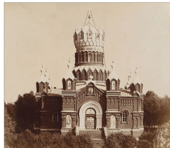
Собор во имя Николая Чудотворца. Николе-Бабаевский монастырь. 1911 г.