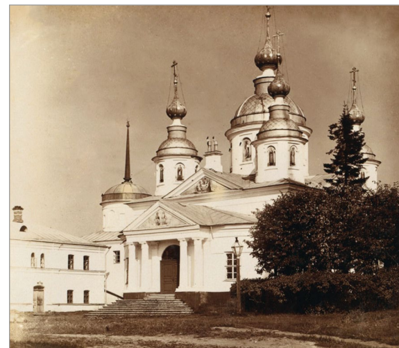
Церковь во имя Николая Чудотворца. Николе-Бабаевский монастырь. 1911 г.