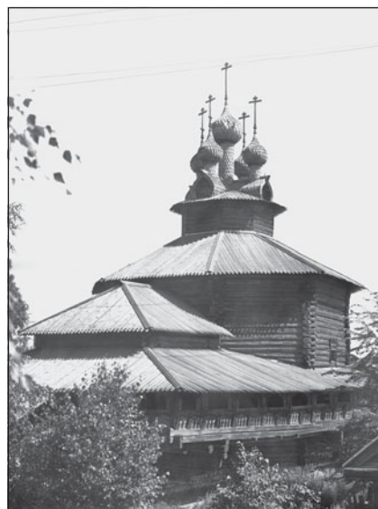
Рис. 4. Богородицкая церковь из с. Холм

сения из с. Билуково, церковью Успения в г. Иваново-Вознесенске и Рождественской церковью с. Талицы позволила обобщить храмы в особую группу. Исследователь при этом не конкретизирует особенности данной группы: «так, существует прионежская школа деревянного зодчества, есть архитектурно-конструктивные приемы, типичные для клетских церквей Ивановской обл.» [12]. Как видно, теоретическая работа А. В. Ополовникова по изучению костромского зодчества связана в первую очередь с практикой реставрации костромских культовых памятников.