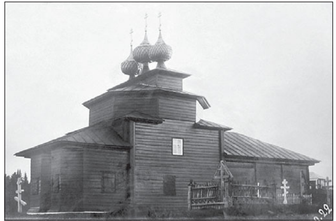
Рис. 5. Рождественский храм в с. Починок Солигаличского района

белло, В. Н. Иванова, П. Н. Максимова «Русское деревянное зодчество» стал масштабным изданием, посвященным этой теме. В монографию вошли три культовых костромских памятника: клетская Спасо-Преображенская церковь в с. Спас-Вежи (рис. 2) и ярусные Николаевская в с. Березовец на Ноле (рис. 3) и Богородицкая церковь из с. Холм (рис. 4). На основании объемной композиции последней авторы издания делают следующий вывод: «Декоративный измельченный верх и приземистые пропорции основного восьмерика являются отличительными приемами костромской архитектурной школы» [11]. Это — первый тезис, свидетельствующий о выявлении региональных особенностей костромского деревянного зодчества.