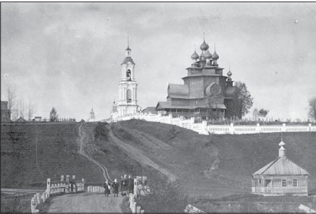
Рис. 3. Ярусная церковь в с. Березовец на Ноле