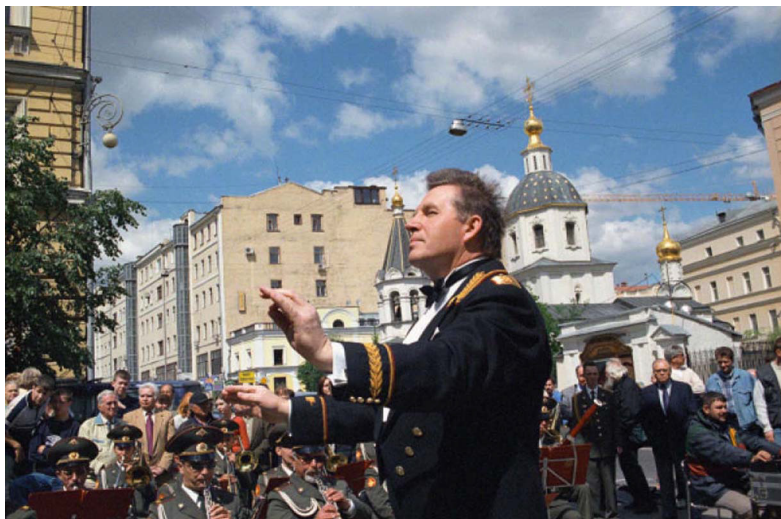
Ил. 1. Генерал-лейтенант В.В. Афанасьев. 2002 г.