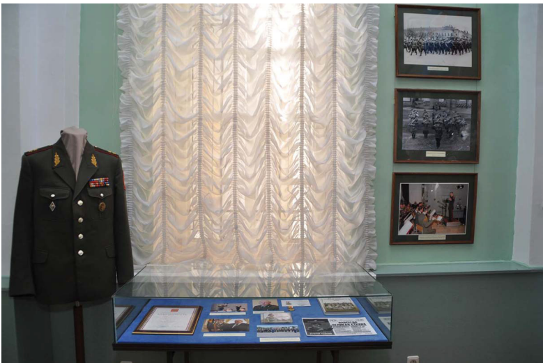
Ил. 4. Китель генерал-лейтенанта В.М. Халилова на выставке «История военных оркестров Костромского гарнизона». 2015 г.