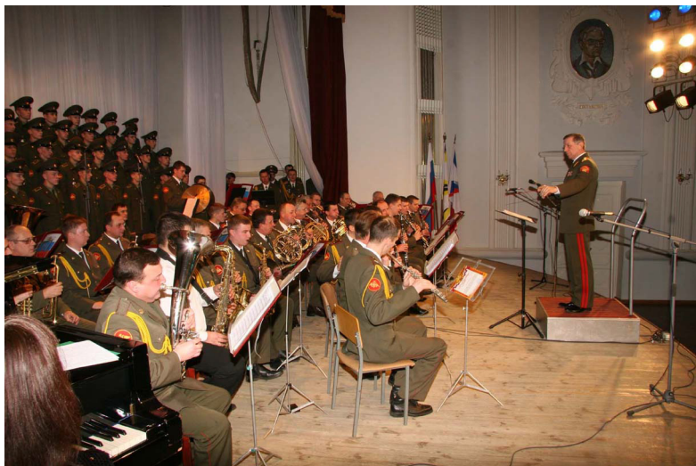
Ил. 2. Генерал-майор (впоследствии – генерал-лейтенант) В.М. Халилов во время концерта в Государственной филармонии Костромской области. 2009 г.