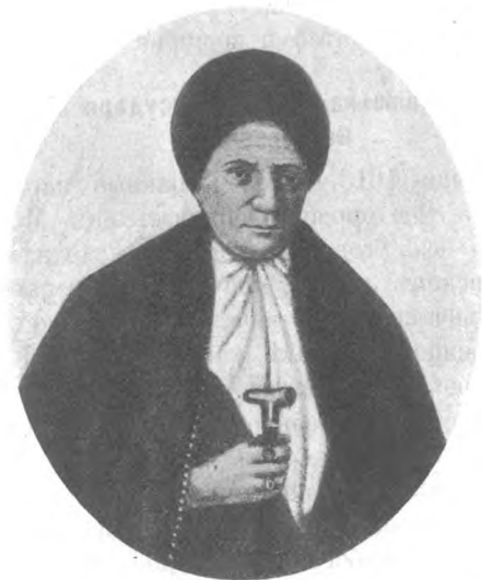
Мать Михаила Феодоровича великая инокиня Марія Іоанновна.