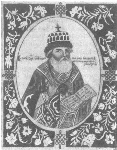
Отецъ Михаила Феодоровича, патриархъ Филаретъ, въ міру бояринъ Феодоръ Никитичъ Романовъ.

же много похвалиль этотъ совѣтъ и плакаль отъ радости. И скоро пошелъ возвѣститъ объ этомъ Освященному собору, боярамъ и воево-