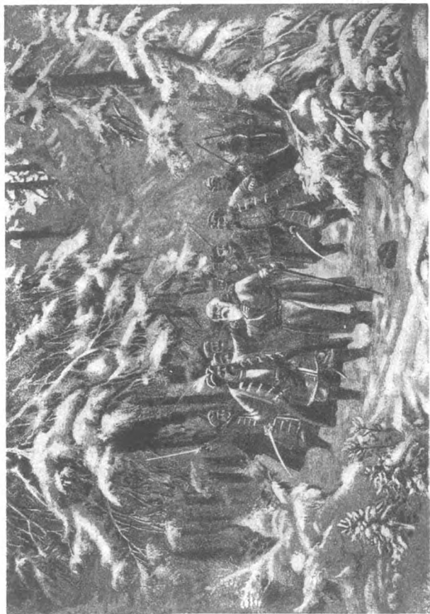
Смерть Ивана Сусанина.