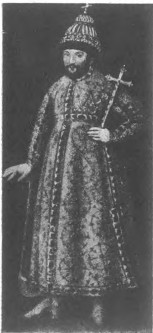
Царь Михаилъ Феодоровичъ (Съ древняго портрета).

многія и не на одинъ годъ. И такія великія деньги и многіе запасы, гдѣ братъ?“