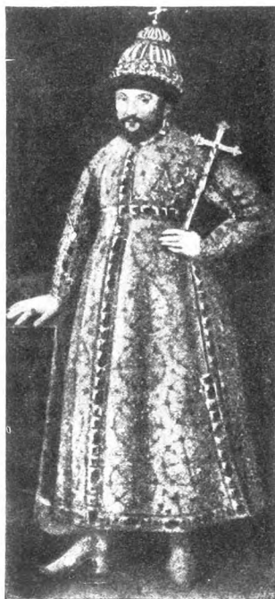
Царь Михаилъ Теодоровичъ (Съ древняго портрета)