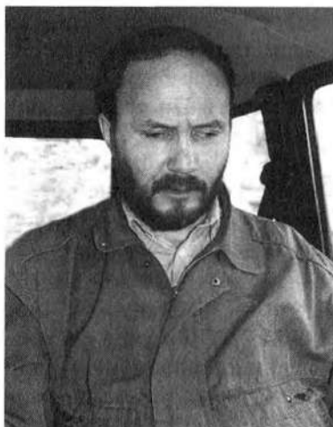
2005 г.