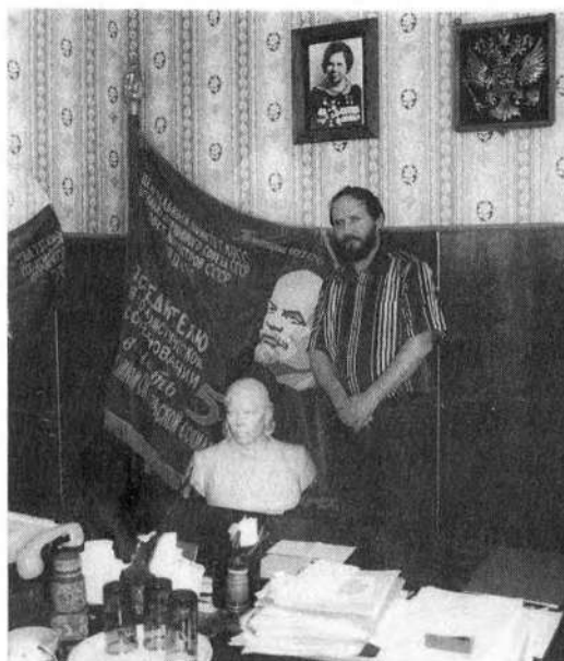
Саметь. В кабинете пред- седателя колхоза «XII Октябрь». 2004 г.