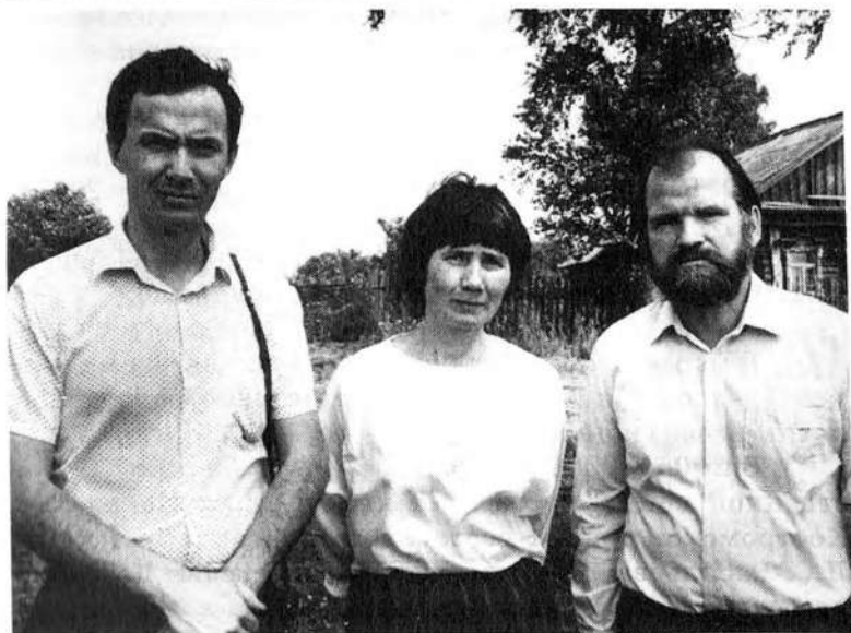
У могилы о. Михаила Диева. 1990 г. Фото Г.П. Белякова , Н.А. Зонтиков, А.В. Соловьева, П.И. Новосельский