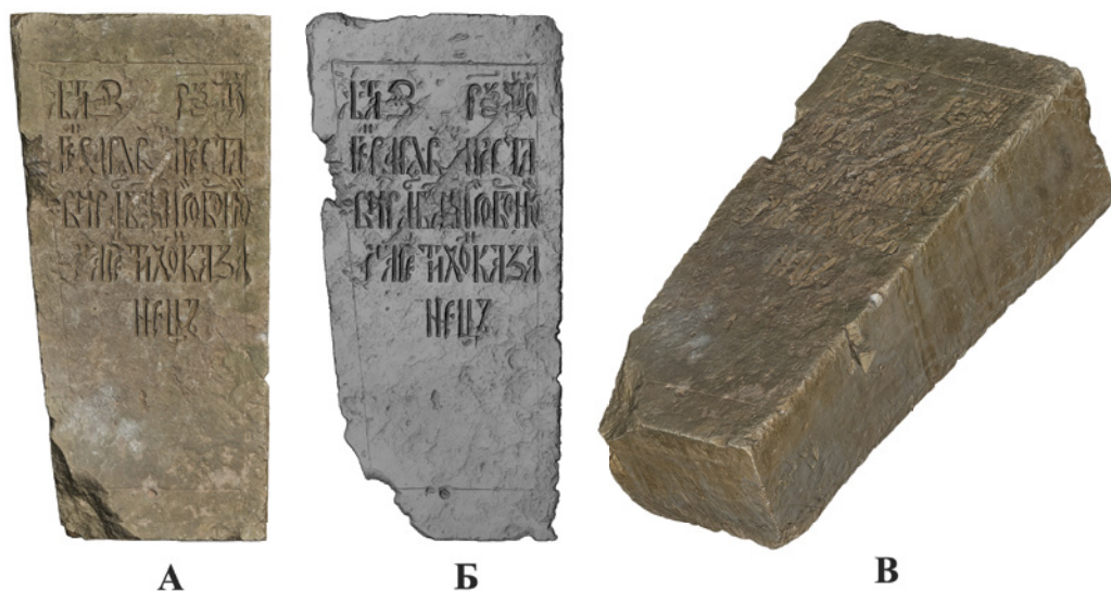
Ил. 3. CIR1006. Эпитафия соборному старцу Тихону Казанцу. Январь 1656 г.

Трёхмерная полигональная модель. А. Поверхность модели с наложенной фотографической текстурой (схема Т). Б. Улучшение читаемости надписи инструментами математической визуализации рельефа поверхности памятника относительно условной «нулевой» плоскости (схема G). В. Визуализации модели памятника по схеме X. Сергиево-Посадский государственный историко-художественный музей-заповедник.